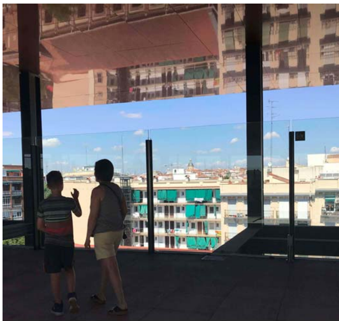
Cine de verano en las terrazas del Museo Reina Sofía

La historia de Lavapiés -lugar donde se asienta el Museo- es la historia de Madrid en su versión más obrera, popular, tumultuosa y rebelde. El primer bloque del ciclo exhibirá el cine histórico pensado y rodado en el barrio analizando diferentes puntos de vista a través de títulos como Esencia de verbena , Domingo de Carnaval , Surcos , El verdugo , Bajarse al moro , Madrid , A ras del suelo y Las manos sobre la ciudad .