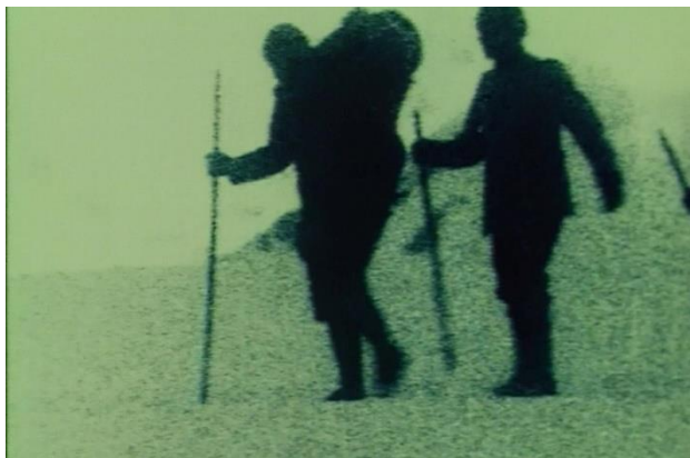
YERVANT GIANIKIAN y ANGELA RICCI LUCCHI Su tutte la vette è pace , 1998 Película

Italia, 1998, color, VO sin diálogos, 72', AD remasterizado. Con música de Giovanna Marini. Producido por el Museo Histórico de Trento y el Museo de la Guerra de Rovereto.