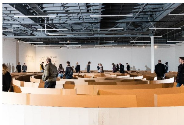
CARLOS BUNGA Doubled Architecture Instalación en MOCAD, Detroit, 2018 Cartón, cinta, pintura látex y pegamento

El programa expositivo arranca con De Posada a Isotype, de Kollwitz a Catlett , que, a partir del 22 de marzo , mostrará al público la evolución de diferentes medios gráficos como el grabado en madera, el linóleo y la litografía y su uso con fines políticos en la primera mitad del siglo XX. Comisariada por el prestigioso historiador Benjamin H.D. Buchloh, la muestra abordará los casos de artistas como el mexicano José Guadalupe Posada y la alemana Käthe Kollwitz, así como las iniciativas emprendidas por el expresionismo alemán -con artistas tales como Otto Dix, Max Beckmann y George Grosz- el Taller de Gráfica Popular de México, o el proyecto Isotype de Otto Neurath, Marie Reidemeister y Gerd Arntz.