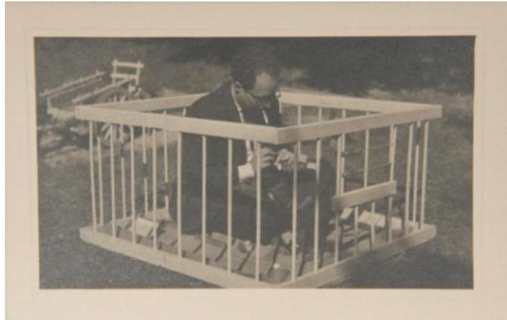
Francesc Tosquelles, años 40

La siguiente exposición en el calendario, Como una máquina de coser en un campo de trigo. La psiquiatría de Francesc Tosquelles , se inaugurará el 27 de septiembre y pretende recuperar la figura del psiquiatra y teórico catalán Francesc Tosquelles (1912, España-1994, Francia). Exiliado en Francia en 1939, Tosquelles dirigió el hospital psiquiátrico de Saint-Alban-sur-Limagnole, una institución que se convirtió en un lugar de referencia en la experimentación de nuevas prácticas clínicas, de desarrollo del Art Brut y de producción de textos críticos sobre la cultura occidental en el cruce de la psiquiatría, el arte, la literatura y la historia política contemporánea.