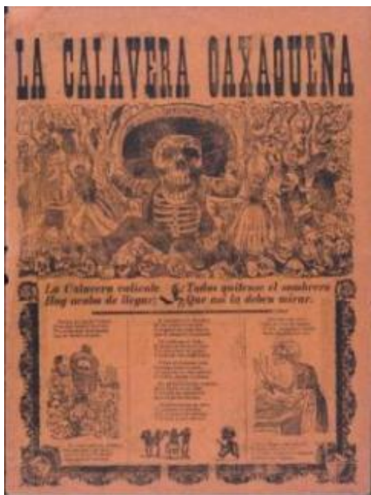
JOSÉ GUADALUPE POSADA La Calavera Oaxaqueña, 1903 Impresión sobre papel de periódico 43 x 30 cm

La agenda se completa con una singular instalación del artista Carlos Bunga , y con las exposiciones dedicadas a la editorial Something Else Press que el artista, músico, poeta y editor Dick Higgins puso en marcha en la década de los 60 como plataforma de activación de prácticas experimentales, o la muestra centrada en la figura del psiquiatra catalán Francesc Tosquelles , que reivindicó la dimensión situada de la terapia institucional desde el hospital de Saint-Alban-sur-Limagnole poniendo el acento en la actividades creativas en el contexto del art brut y del surrealismo. Otra exposición rastrea la protohistoria de la fotografía documental desde 1838 hasta 1917, reuniendo materiales originales desde daguerrotipos y fotografías en calotipo hasta álbumes y publicaciones. Con ella se completa una teatología sobre el papel de la fotografía que el Museo inició en 2011 con la exposición Una luz dura, sin compasión. El movimiento de la fotografía obrera, 1926-1939 .