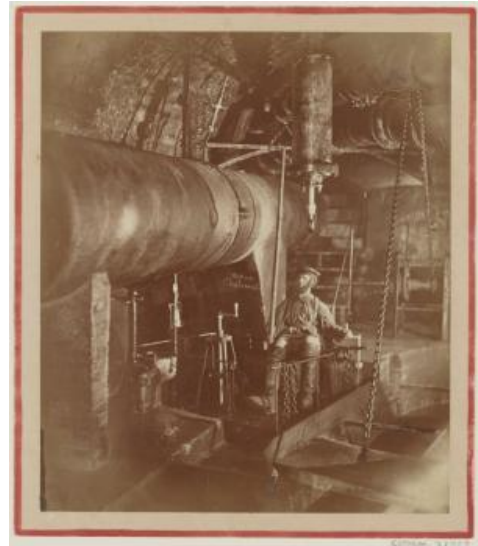
NADAR Cloacas de Paris: rue due Château d'Eau, n° 2, ca. 1864-1865 Fotografía a la albúmina sobre cartón, 22 x 19 cm Bibliothèque nationale de France. Richelieu, Département d'estampes et photographie, EO-15 (21)-PET FOL