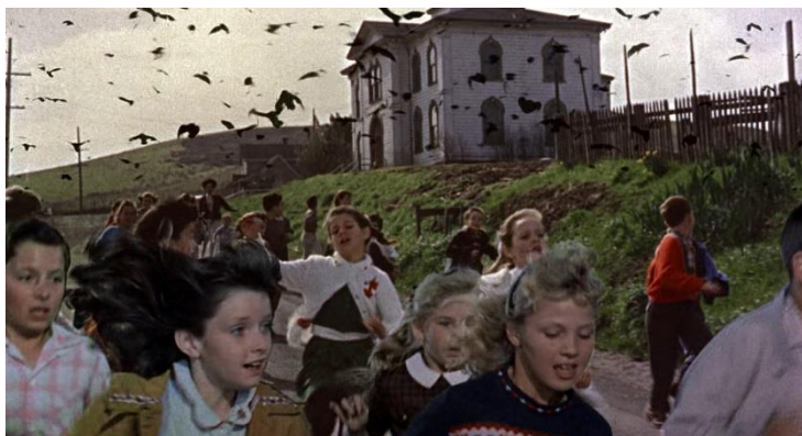
ALFRED HITCHCOCK Los pájaros [The Birds]. 1963

El cine de verano se inaugura con una pieza experimental del artista sonoro y sonidista Juan Carlos Blancas quien presenta un paisaje acústico de sonidos relacionados con experiencias vividas durante el confinamiento, en diálogo con la película que se proyecta a continuación y el espacio natural del jardín.