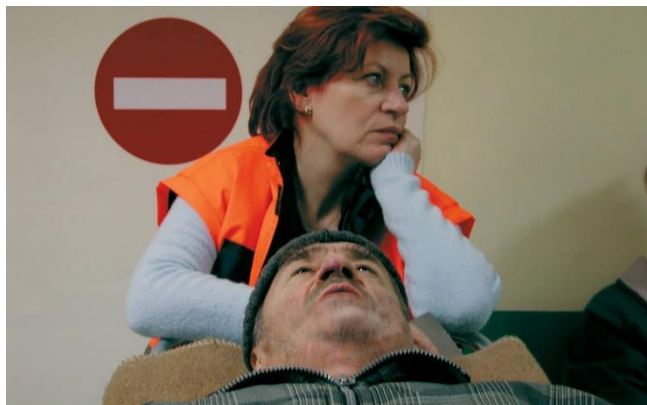
CRISTI PUIU La muerte del señor Lazarescu (Moartea domnului Lăzărescu), 2005

El filme trata el colapso del sistema sanitario a través de la odisea de un anciano moribundo que no encuentra acomodo en ningún hospital. El señor Lazarescu es un anciano que vive solo con sus tres gatos. Una noche se encuentra mal y llama a una ambulancia. Pero esa misma noche un espectacular accidente ha colapsado todos los hospitales de la ciudad. Durante toda la noche, el anciano agonizante y su enfermera tratarán de lidiar con un sistema sanitario caótico y desestructurado, con la burocracia, los prejuicios y la corrupción. La tragedia y el abandono de los mayores durante la fase aguda de la pandemia y la devoción sin límites del personal sanitario, en una comedia negra que es también un retrato de la sociedad rumana poscomunista.