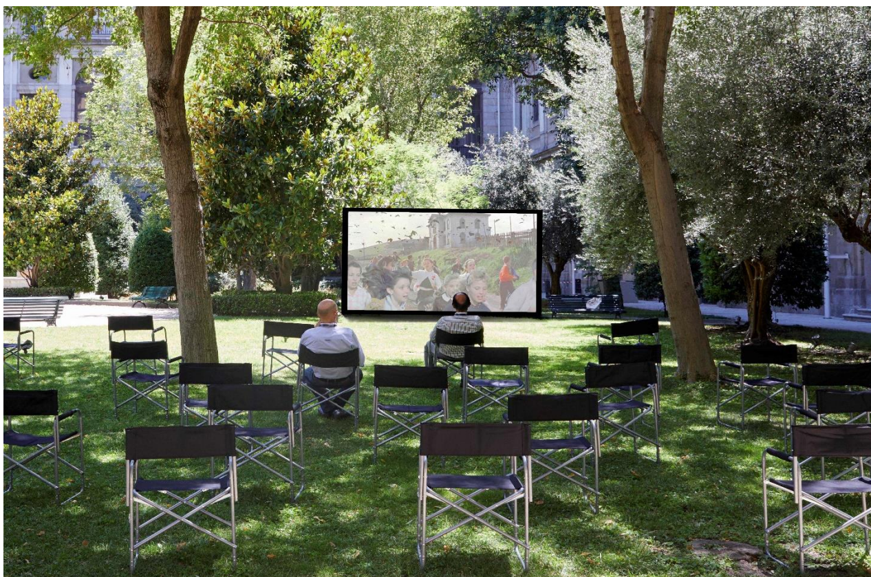
Cine de Verano Tiempos inciertos III. Sostener las vidas en el Jardín Sabatini del Museo Reina Sofía (Simulación). Julio, 2020.

En los últimos meses se han podido ver a través del canal de Vimeo del Museo las dos primeras partes del ciclo audiovisual Tiempos inciertos programadas por el Reina Sofía, y que han tratado