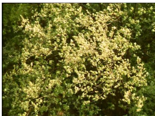
FRANCO PIAVOLI El planeta azul (Il pianeta azzurro) . 1982

El planeta azul nos devuelve al tiempo cíclico de las estaciones, al paisaje natural en todo su esplendor y a la figura humana como un detalle más dentro de un sistema de múltiples vidas y especies. Piavoli compone en esta histórica ópera prima, alabada por Bertolucci o Tarkovsky, una sinfonía sensorial que celebra la vida a través del transcurrir del tiempo. También nos muestra otra relación con la naturaleza, ética y bella a partes iguales, en la que el ser humano ya no es el centro del universo, sino otra vida más. Por su parte, David Varela parte de Piavoli para componer una distopía sobre la catástrofe ecológica a medio camino entre el realismo fáctico y la ciencia-ficción. Un cortometraje que, limitándose a filmar las semanas de confinamiento, compone un relato desasosegante sobre la extinción.