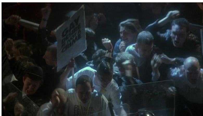
DEREK JARMAN Edward II . Película, 1991

Película inspirada en la tragedia de 1562 de Christopher Marlowe sobre la muerte de Eduardo II, se trata de otro caso de relectura queer de la historia