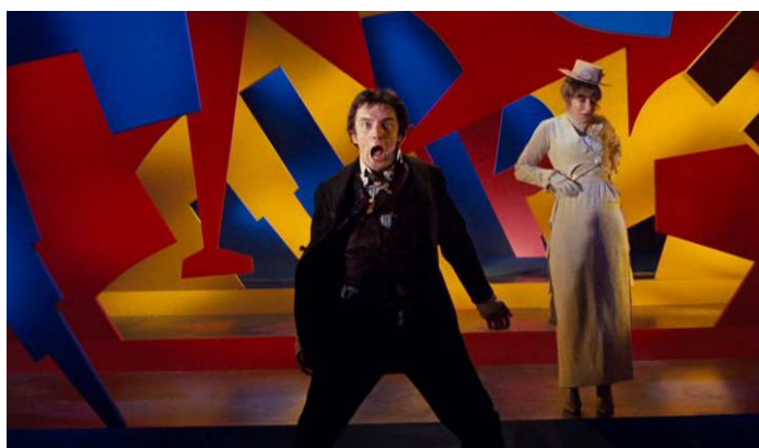
KEN RUSSELL Savage Messiah . Película, 1972

Película biográfica sobre el escultor vanguardista Henri Gaudier-Brzeska (1891-1915) y segunda colaboración entre Ken Russell y Derek Jarman, tras The Devils . De nuevo, Jarman vuelve a realizar la escenografía y ambientación histórica. Russell confesará su interés en Jarman al considerarle el último bohemio de verdad , aproximándole al tema real de la película. El filme es tanto la vida de un artista contra las convenciones