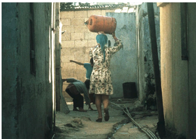
JOCELYN SAAB Les Femmes palestiniennes [Mujeres palestinas]. Película, 1974

Continuando con sus líneas de trabajo de largo recorrido, el Museo Reina Sofía no circunscribe a una fecha determinada la realización de determinadas actividades para conmemorar el Día Internacional de la Mujer. La estrategia desarrollada en los últimos años hace visible de manera permanente diferentes propuestas que no se ciñen a una circunstancia, manteniendo conexiones transversales entre las distintas actuaciones.