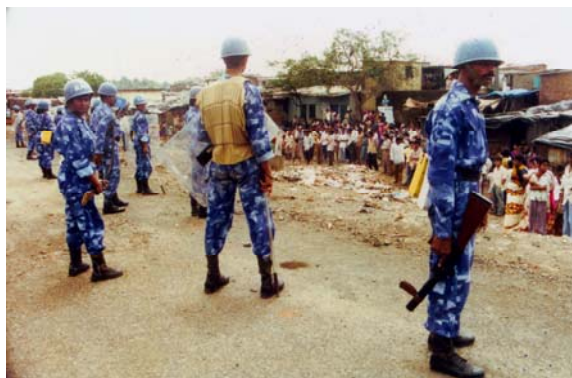
Anand Patwardhan. Jai Bhim Comrade . Película, 2011. Cortesía del artista

Estrenada en España en esta proyección, Jai Bhim Comrade narra la historia de la atrocidad del sistema de castas en la India a través de canciones, poesía y cultura de resistencia desde abajo. Rodada a lo largo de 14 años, esta obra maestra realizada por el reputado documentalista indio investiga las terribles circunstancias de los Dalits en este país, denigrados a “intocables” durante miles de años, a los que se niega educación y acceso a instituciones religiosas, encargados del trabajo manual más bajo.