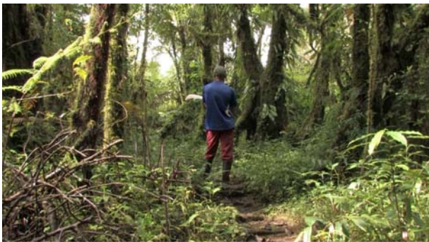
Los Hijos. Árboles. Película, 2013.

En Tierra de nadie de Salomé Lamas nos encontramos con un mercenario y asesino a sueldo portugués que relata sus experiencias luchando en los últimos días del África colonial y como agente del GAL (Grupos Antiterroristas de Liberación), participando en los escuadrones parapoliciales organizadas por el Estado español contra ETA y sus últimos refugios en Francia.