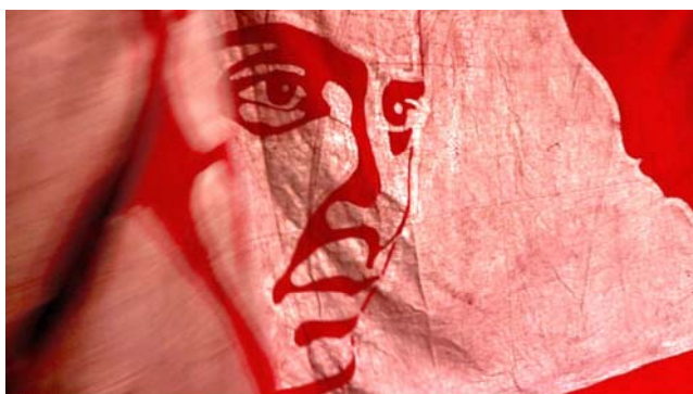
Sanjay Kak. Red Ant Dream. Película, 2013. Cortesía del artista y Octave Communications Production

Sanjay Kak. Red Ant Dream , 2013. Digital, VOSE, 120'. Distribución: Octave Communications Production.