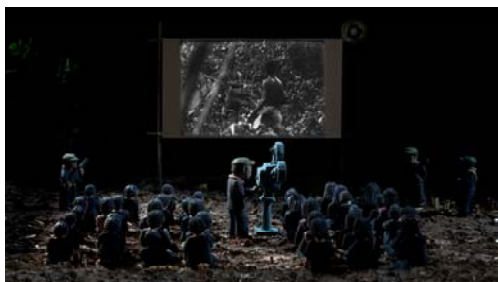
Rithy Panh. La imagen perdida . Película, 2013.

Rithy Panh. La imagen perdida , 2013. Digital, VOSE, 90'. Distribución: Abordar-Casa de películas.