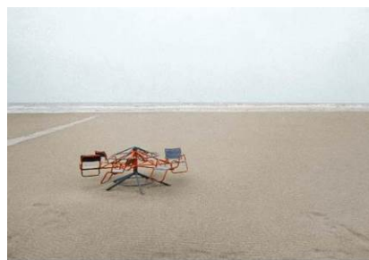
LUIGI GHIRRI Libro di Spina, 1974 Fotografía color. 13 x 19 cm.

El programa expositivo arranca el 25 de septiembre con una monográfica dedicada a Luigi Ghirri , uno de los fotógrafos italianos más apreciados de todos los tiempos. Esta exposición, titulada El mapa y el territorio supone el primer estudio significativo de las fotografías de Luigi Ghirri presentadas fuera de Italia.