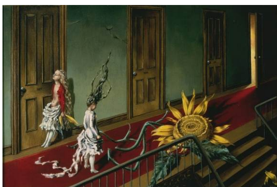
DOROTHEA TANNING Eine Kleine Nachtmusik [Un poco de música nocturna], 1943 Óleo sobre lienzo Tate: Adquirida con la ayuda de Art Fund and the American Fund for the Tate Gallery 1997

El 2 de octubre de 2018 se inaugura Detrás de la puerta, invisible, otra puerta , la primera gran retrospectiva de la surrealista norteamericana Dorothea Tanning , una de las artistas más singulares del siglo XX.