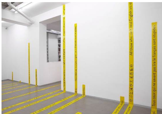
LUIS CAMNITZER Insulte (Insultos), 2009 Vitrío Dimensiones variables Colocación del artista. Alexander Gray Associates, New York.

Otra retrospectiva programada será la del artista uruguayo Luis Camnitzer , una de las figuras claves del arte conceptual latinoamericano del que se destaca su trabajo en términos de pedagogía. La muestra propone una revisión de toda su obra a través de un recorrido por sus trabajos más emblemáticos, atendiendo a los conceptos claves de su trayectoria.