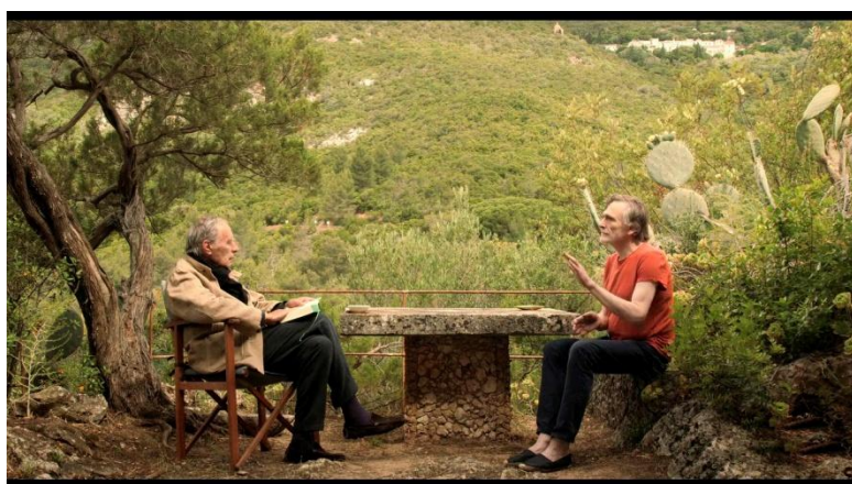
PIERRE LÉON, RITA AZEVEDO GOMES Y JEAN-LOUIS SCHEFER. Danses macabres, squelettes et autres fantaisies [Danzas macabras, esqueletos y otras fantasías] Francia, Portugal, Suiza, 2019 Color, VO en francés subtitulada al español, archivo digital, 110'

Preestreno nacional. Francia, Portugal, Suiza, 2019, color, VO en francés subtitulada al español, archivo digital, 110'