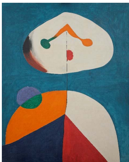
JOAN MIRÓ Portrait II (Retrato II) , 1938. Óleo sobre lienzo. 162 x 130 cm Museo Reina Sofía