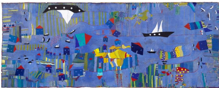
HUGUETTE CALAND, Le Grand Bleu , 2012. Colección particular. © Cortesía de Huguette Caland Estate. Fotografía: © Cortesía de Huguette Caland Estate

Del 19 de febrero a 25 de agosto de 2025