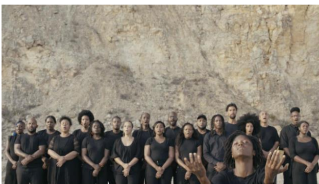
GRADA KILOMBA Opera to a Black Venus , 2024 Proyección monocanal con un canal de sonido

La exposición individual Opera to a Black Venus , dedicada a la artista portuguesa residente en Berlín, Grada Kilomba (Lisboa, 1968), reúne en una selección de ocho obras de carácter instalativo, la presentación más completa de sus trabajos hasta la fecha en España. Kilomba es conocida por su singular manera de contar historias, en las que da cuerpo, voz, forma y movimiento a sus propios textos a través de performances, lecturas escenificadas, vídeos, esculturas, instalaciones y paisajes sonoros. ¿Qué historias se cuentan? ¿Cómo se cuentan? ¿Y quién las cuenta? son preguntas que persisten en la obra de Kilomba.