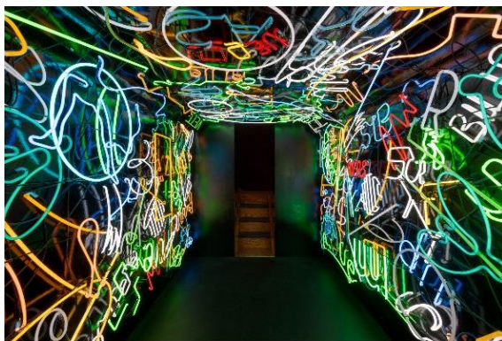
MARTA MINUJIN La Menesunda: según Marta Minujín 2024 Vista de la instalación en Intensify Life. Copenhagen Contemporary

Del 5 de noviembre de 2025 a 16 de marzo de 2026