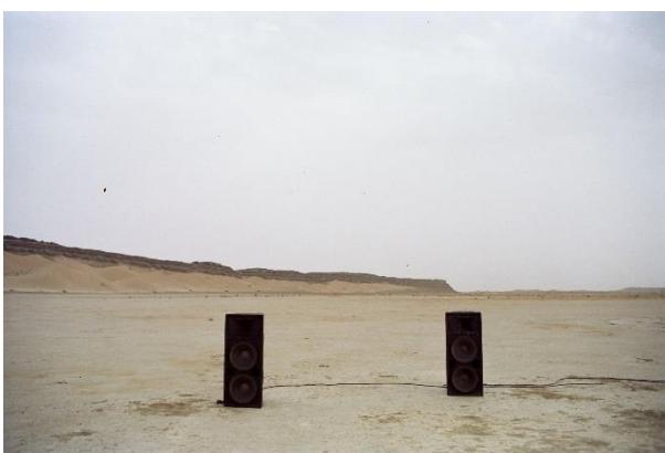
OLIVER LAXE. "HU/هو. Bailad como si nadie os viera". Instalación, 2025

Del 1 de octubre de 2025 a 9 de marzo de 2026