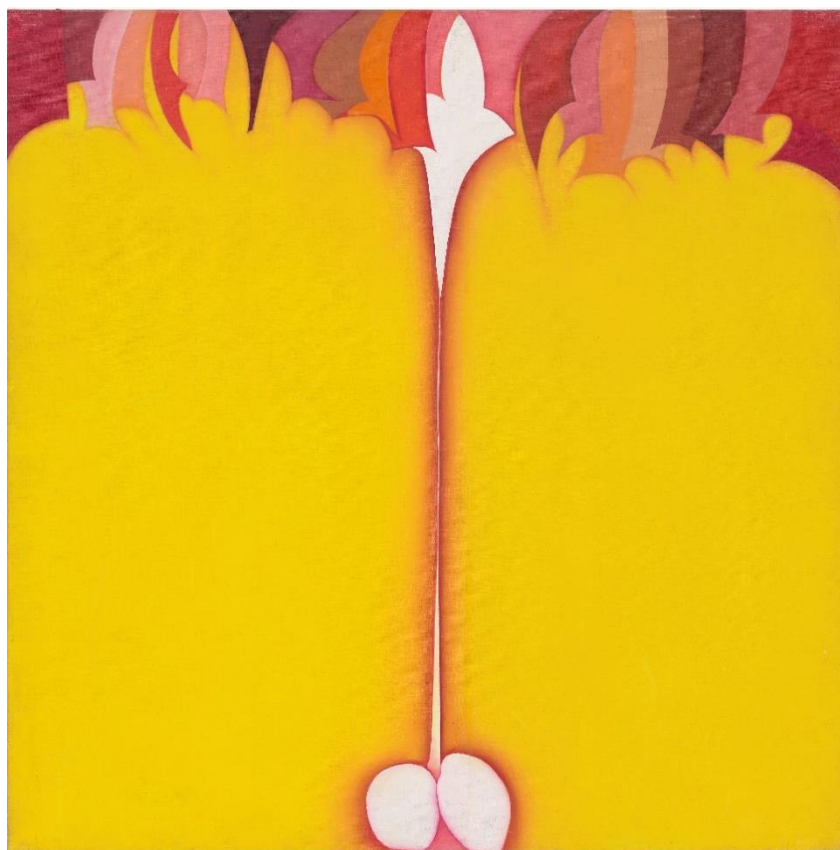
HUGUETTE CALAND. Visages, 1979. Óleo sobre lienzo. 80 x 80 cm. The Museum of Modern Art, New York. Gift of Sandra and Tony Tamer, Anonymous, Xin Zhang, Lonti Ebers and The Modern Women's Fund, 2021. © Cortesía de Huguetta Caland Estate. Foto: © 2024 Digital image, The Museum of Modern Art. New York / Scala. Florence