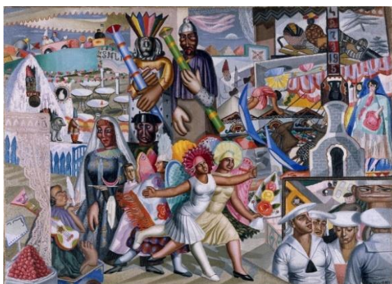
MARUJA MALLO La verbena , 1927 Óleo sobre lienzo 119 x 165 cm Museo Nacional Centro de Arte Reina Sofía © Maruja Mallo, VEGAP, Madrid, 2012

Del 8 de octubre de 2024 al 16 de marzo de 2026