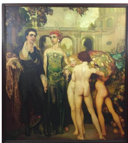
NÉSTOR MARTÍN-FERNÁNDEZ DE LA TORRE Epitalmio (o las bodas del príncipe Néstor) , 1909. Museo Néstor, Las Palmas de Gran Canaria.

Del 14 de mayo al 8 de septiembre de 2025