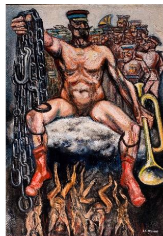
JOSÉ CLEMENTE OROZCO El tirano, 1947 Temple sobre tela. 93 x 66 cm Acervo Museo de Arte Moderno, INBAL/Secretaría de Cultura. © Herederos de José Clemente Orozco, 2024

Esta exposición aborda el concepto de «esperpento» formulado por el escritor Ramón María del Valle-Inclán (1866-1936) como herramienta de cuestionamiento crítico, en reacción al atraso y la desesperanza moral que asolaba España en el primer tercio del siglo XX. El esperpento confrontó el encorsetamiento social, político y cultural del país, insistiendo en el distanciamiento de la mirada y en una serie de estrategias estéticas que desplegaron su máxima eficiencia en la deformación. La exposición está planteada en siete grandes secciones, desde una primera que presenta la génesis del esperpento, hasta una séptima sección y conclusión que toma el título de El ruedo ibérico , nombre del último esperpento inacabado de Valle-Inclán.