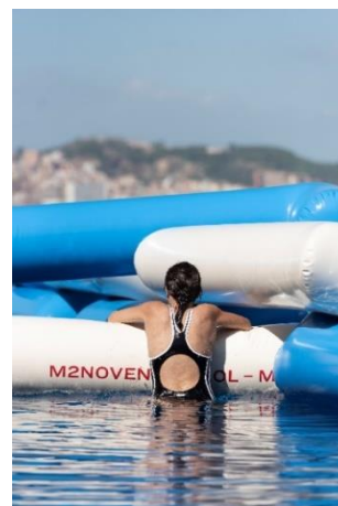
LAIA ESTRUCH. Vista de Crol ( Crawl ), 2019

La práctica de Laia Estruch (Barcelona, 1981) aborda la voz humana como un elemento material y las cuerdas vocales como herramientas, explorando así un lenguaje sonoro que va más allá de la mera interpretación de palabras habladas o cantadas. Este proceso de creación se desarrolla normalmente en escenarios escultóricos interactivos, y a menudo monumentales, que la artista crea para cada proyecto vocal. Hello Everyone , comisariada por Latitudes (Mariana Canepa y Max Andrews), reunirá los proyectos que Laia Estruch ha producido desde el 2011 hasta la fecha, presentados de manera conjunta como una nueva instalación: