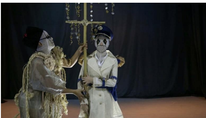
NAUFUS RAMÍREZ-FIGUEROA. Lugar de consuelo , 2020 Video, color, sonido, 35'26". Museo Nacional Centro de Arte Reina Sofía Depósito indefinido de la Fundación Museo Reina Sofía, 2022 (Donación de Francesca Thyssen-Bornemisza)

En la narrativa plástica de Naufus Ramírez-Figueroa (Ciudad de Guatemala, Guatemala, 1978) se entrelazan los objetos escultóricos, la performance y las grabaciones fílmicas y de sonido. Esta exposición, organizada por el MNCARS con el apoyo de la Fundación TBA21 | Thyssen-Bornemisza Art Contemporary, pretende acercarse a la