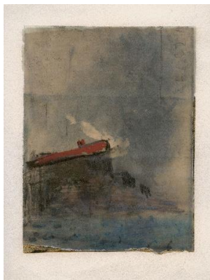
JUAN USLÉ Unidad , 1987 Técnica mixta sobre papel, 20 x 15,5 cm Colección de arte

Veinte años después de Open Rooms , la primera exposición que el Museo Nacional Centro de Arte Reina Sofía dedicó a Juan Uslé (Santander, 1954), el artista presentará una gran muestra antológica que ahondará en sus más de cuarenta años de trayectoria artística. Las diez salas en las que se desplegará esta exposición se plantean como un relato no cronológico sino de idas y vueltas, de retroacción y prospección. Se trata de una nueva mirada sobre la obra de un artista que, en los últimos años, ha contado con importantes muestras antológicas a nivel internacional, y citas que lo sitúan como uno de los artistas españoles más destacados de las últimas décadas.