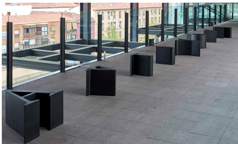
ELENA ASINS Antígona , 2014 Acero Cortén Varias piezas. Dimensiones variables Museo Nacional Centro de Arte Reina Sofía Herencia Elena Asins, 2017

A partir de mediados de los sesenta, Asins se decanta por la abstracción geométrica más rigurosa. En concreto en 1964 comienza a participar en los proyectos de experimentación multidisciplinar de la Cooperativa de Producción Artística y Artesana de Ignacio Gómez de Liaño , y desde 1968 en los seminarios del Centro de Cálculo de la Universidad de Madrid. La artista estuvo siempre interesada en conocer directamente las experiencias que se hacían fuera de España en el campo del arte abstracto geométrico; vivió durante un tiempo en Alemania; entre 1969 y 1970, donde entró en contacto con el científico y filósofo Max Bense, uno de los fundadores de la semiótica.