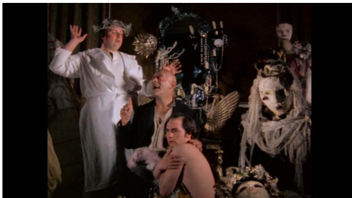
DEREK JARMAN The Tempest . Película, 1979

Este ciclo se enmarca en el proyecto iniciado en 2016 por el Museo Reina Sofía y Filmoteca Española, consistente en desarrollar retrospectivas