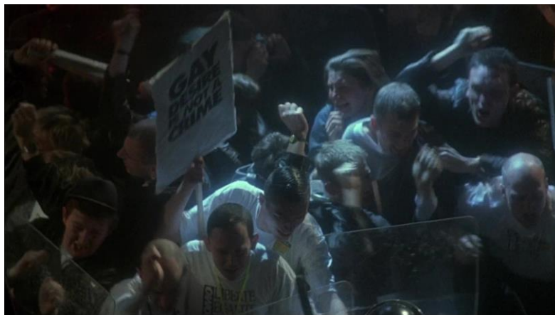
DEREK JARMAN Edward II . Película, 1991

Película inspirada en la tragedia de 1562 de Christopher Marlowe sobre la muerte de Eduardo II, se trata de otro caso de relectura queer de la historia