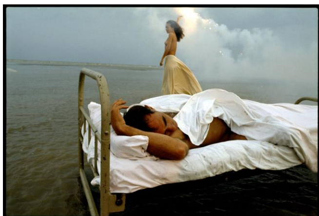
DEREK JARMAN The Garden. Película, 1990