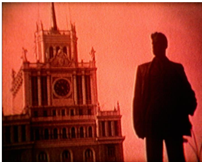
DEREK JARMAN Imagining October . Película, 1984

Reino Unido, 1987, color, VO en inglés con subtítulos en español, betacam, 27'