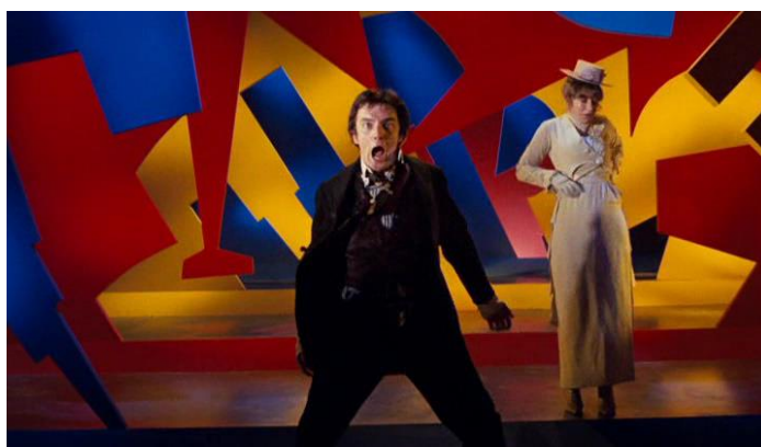
KEN RUSSELL Savage Messiah . Película, 1972

Película biográfica sobre el escultor vanguardista Henri Gaudier-Brzeska (1891-1915) y segunda colaboración entre Ken Russell y Derek Jarman, tras The Devils . De nuevo, Jarman vuelve a realizar la escenografía y ambientación histórica. Russell confesará su interés en Jarman al considerarle el último bohemio de verdad , aproximándole al tema real de la película. El filme es tanto la vida de un artista contra las convenciones