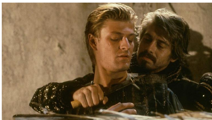
DEREK JARMAN Caravaggio . Película, 1986

El Museo Reina Sofía y Filmoteca Española organizan la retrospectiva más completa hasta la fecha dedicada al cineasta, poeta, escenógrafo y activista histórico por los derechos homosexuales Derek Jarman (Middlesex, 1942-Londres, 1994).