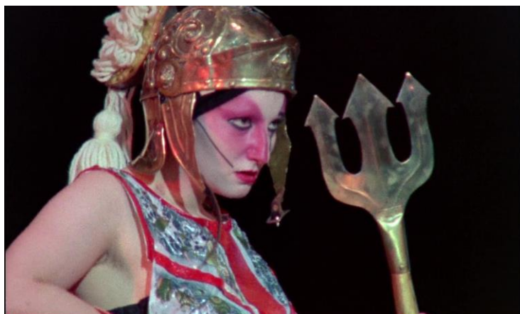
DEREK JARMAN Jubilee . Película, 1978

Segundo pase: miércoles 9 de diciembre, 2020 -19:00 h / Museo Reina Sofía, Edificio Sabatini, Auditorio