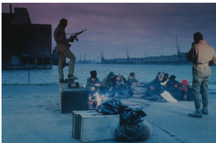
DEREK JARMAN The Last of England . Película, 1987

Segundo pase: domingo 13 de diciembre 19:00 h / Filmoteca Española, Cine Doré, Sala 1 Reino Unido, 1987, color, VO en inglés con subtítulos en español, DCP en Cine Doré y B-R en Museo Reina Sofía, 87'