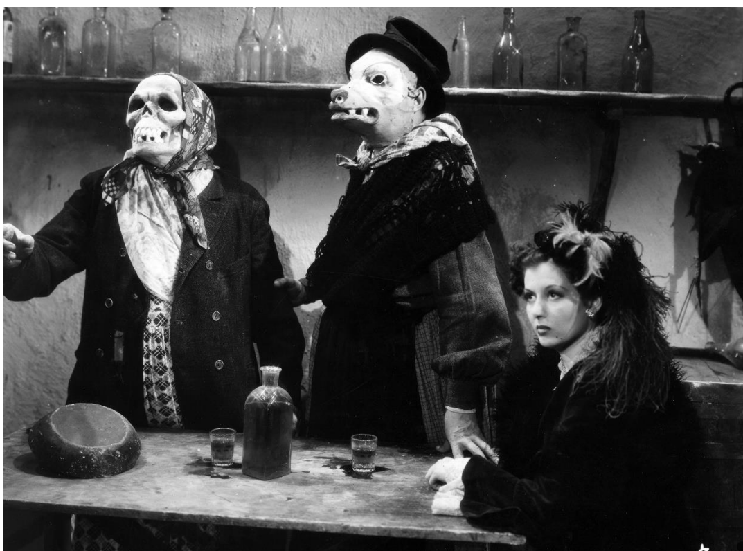
Edgar Neville, Domingo de Carnaval , película, 1945