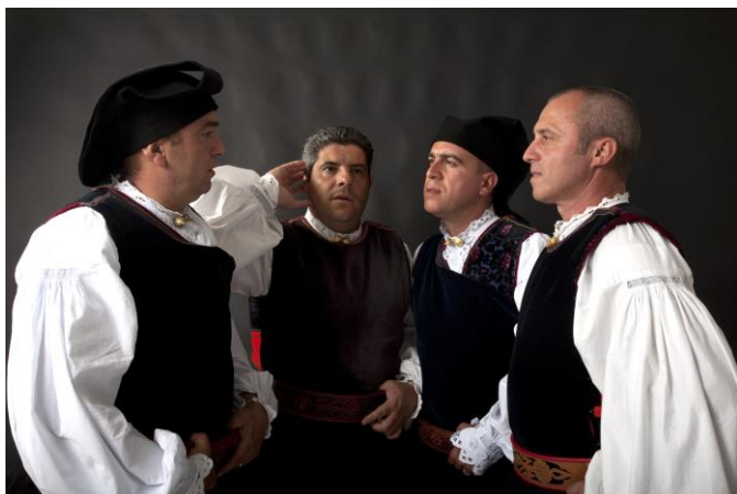
Tenores di Bitti "Mialinu Pira"

El canto a tenore es una forma de polifonía dentro de la cultura pastoral de Cerdeña. Los grupos están formados por cuatro voces: bassu, contra, boche y mesu boche. Reunidos en círculo, los intérpretes entonan el timbre profundo y gutural de los bassu y contra. Según la etnomusicóloga polaca Bożena Muszkalska, en Cerdeña se piensa que el canto a tenore vincula a pastores, rebaños y montañas. De esta