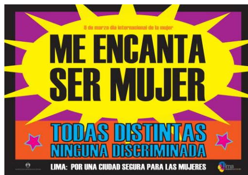
Natalia Iguiñiz Me encanta ser mujer , 2012 Impresión offset sobre papel, 57 x 84 cm.

Un conjunto de serigrafías, impresiones y fotografías de la peruana Natalia Iguiñiz se incorporarán a la Colección del Museo gracias a las donaciones de Marga Sánchez y la propia artista. El colectivo mexicano Fuente Rojas , y otro artista, en este caso el peruano Herbert Rodríguez , han donado también varias obras suyas. Finalmente, Konigsberg Estate ha completado su donación del pasado año de Oyvind Fahlström con dos obras más del mismo artista.