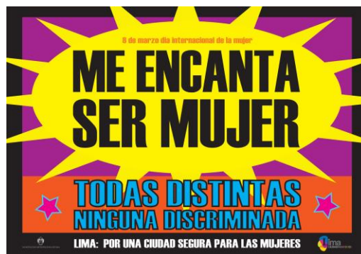
Natalia Iguiñiz Me encanta ser mujer , 2012 Impresión offset sobre papel, 57 x 84 cm.

Un conjunto de serigrafías, impresiones y fotografías de la peruana Natalia Iguiñiz se incorporarán a la Colección del Museo gracias a las donaciones de Marga Sánchez y la propia artista. El colectivo mexicano Fuente Rojas , y otro artista, en este caso el peruano Herbert Rodríguez , han donado también varias obras suyas. Finalmente, Konigsberg Estate ha completado su donación del pasado año de Oyvind Fahlström con dos obras más del mismo artista.