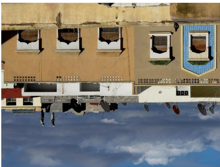
Tiznit, 2013.

El próximo 31 de marzo se inaugura en el Museo Reina Sofía Trilogía marroquí 1950-2020 , una exposición que recorre la evolución cultural del país magrebí durante las últimas décadas a través de unas 250 obras y que ha sido organizada en el marco del programa de cooperación cultural entre España y Marruecos en el ámbito de Museos, promovida por la Fundación Nacional de Museos del Reino de Marruecos y el Ministerio de Cultura y Deporte del Gobierno de España, en colaboración con Mathaf: Arab Museum of Modern Art de Qatar. Paralelamente a la muestra el Museo ha organizado, junto con