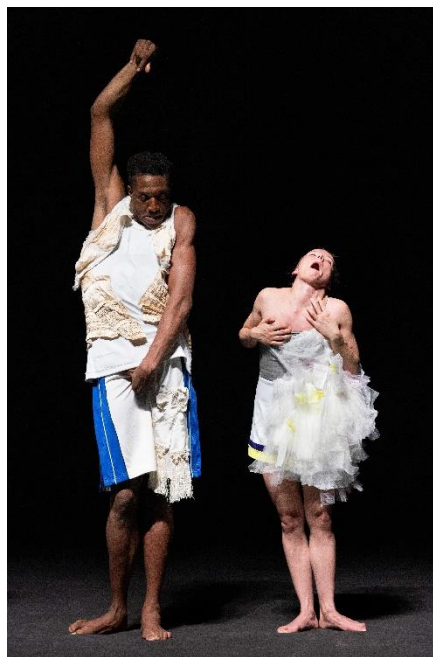
ESZTER SALAMON MONUMENT 0.6: Heterochrony , 2019

El registro en vídeo de la danza fue en su momento una revolución en la historia de este arte, dado que hasta entonces no había más soporte para la danza que el propio cuerpo de los coreógrafos y bailarines, y eso, irremediabilmente, se terminaba perdiendo. En los últimos años, esta práctica ha ganado espacio e incidencia, no solo por su finalidad documentalística, sino porque la danza ofrece una posibilidad de deleite visual que, bien llevada a la pantalla (solo hay que pensar en Pina, la película de Wim Wenders), es incontestable.