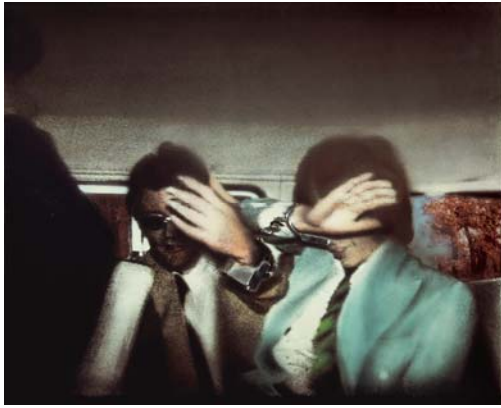
Swinging London 67 (f) , 1968-1969. Serigrafía sobre lienzo, acrílico y collage. 67 x 85 cm. Tate: adquirido en 1969