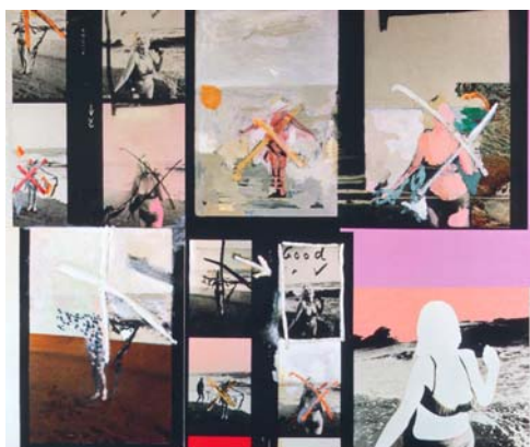
My Marilyn (Mi Marilyn) , 1965. Óleo, collage y fotografía sobre tabla. 102,5 x 122 cm. Colección Ludwig, Ludwig Forum für Internationale Kunst, Aquisgrán

El público podrá contemplar así las obras más emblemáticas de este creador, como su collage Just What is it that Makes Today's Homes So Different, So Appealing (Qué es lo que hace las casas de hoy tan diferentes, tan atractivas), un fotomontaje que está considerado la obra primigenia del pop art .