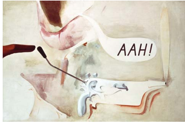
AAH! , 1962. Óleo sobre tabla. 81 x 122 cm. Hessisches Landesmuseum Darmstadt

Otras de sus más famosas e icónicas creaciones presentes en la exposición son la carátula del doble disco White Album de los Beatles o Swinging London 67 , obra en la que Hamilton, asociado a menudo con los acelerados años 60, pintó a Mick Jagger y el marchante de arte Robert Fraser, con esposas, tras una redada antidrogas. Sus series My Marilyn , Interior , The Solomon R. Guggenheim o las reproducciones de Duchamp forman parte también de la muestra. Por otra parte, se recrearán cinco instalaciones de gran envergadura que el artista diseñó o contaron con su participación. Todas ellas se han reconstruido siguiendo sus indicaciones y algunas constituyen momentos cumbre del pop ( An exhibit o This is tomorrow ). Así mismo, la instalación Growth and Form , de 1951, será reconstruida por primera vez. También hay que decir que se verá la última obra realizada por Hamilton, en la que trabajó antes de morir y no llegó a titular.