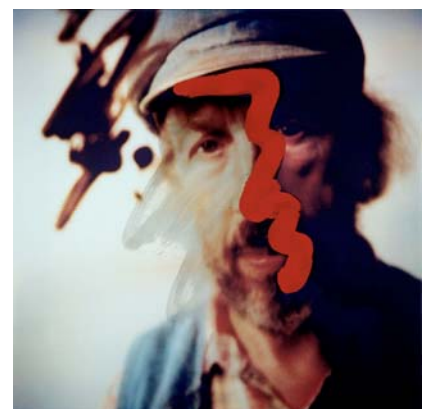
Self-portrait 13.7.80 a (Autorretrato 13.7.80 a) , 1990. Óleo sobre Cibachrome montado sobre lienzo. 75,4 x 75,6 cm. IVAM, Institut Valencià d'Art Modern, Generalitat