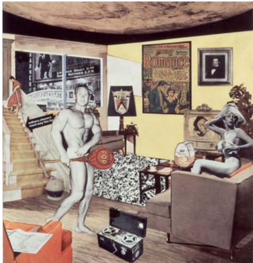
Just what is it that makes today's homes so different, so appealing? (¿Qué es lo que hace que las casas de hoy sean tan diferentes, tan atractivas?). 1956, reproducida por Richard Hamilton en 1992. Cibachrome. 26 x 25 cm. Colección particular

Componen la exposición unas 270 obras del artista británico, una de las figuras más destacadas del pop art .