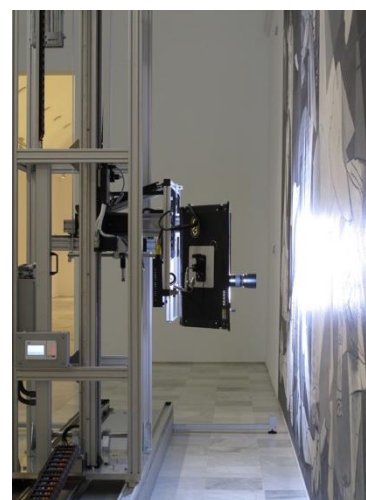
Automatismo robotizado instalado frente al Guernica para su estudio