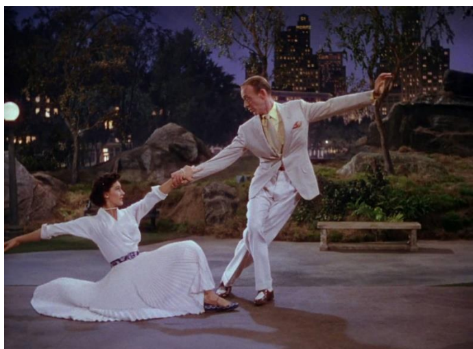
VINCENT MINNELLI Melodías de Broadway . Película, 1953

Un año más regresa el cine de verano al Museo Reina Sofía con El mundo es la escena: ¡musicales! , entendido como un género de carácter lúdico y festivo, pero también como un discurso que incorpora novedosas rupturas en formatos y narrativas.