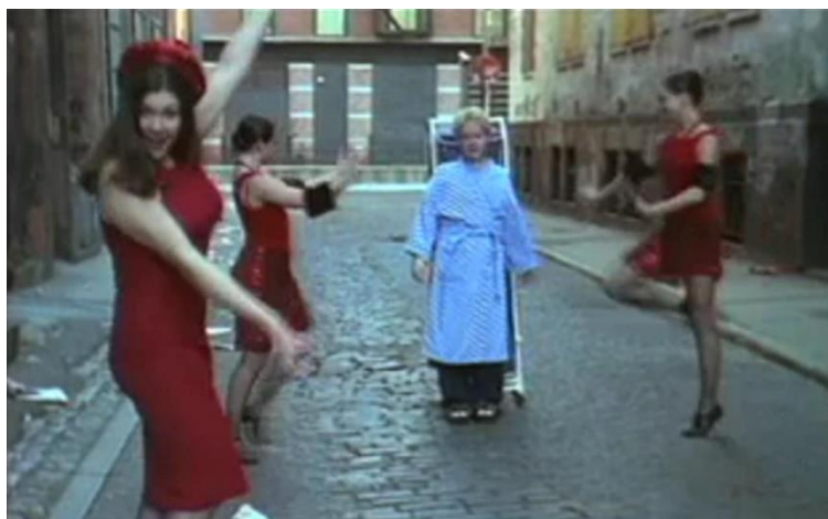
JOANNE NUCHO Gigi (from 9 to 5) Película, 2001

El musical a cargo de cineastas mujeres es inseparable de las luchas del movimiento feminista. Este género fílmico, quizás por su asociación a priori con la levedad y el entretenimiento, ha permitido películas históricas dentro del cine feminista más reivindicativo. En esta sesión proyectamos dos de ellas, el mediometraje musical sobre el divorcio en la España franquista, a cargo de Cecilia Bartolomé, primera mujer en licenciarse como directora en España, y el musical neorrealista de Agnès Varda sobre el aborto.