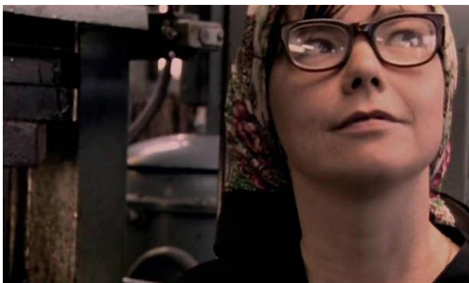
LARS VON TRIER Bailar en la oscuridad . Película, 2000

Melodrama musical sin artificios y rodado cámara al hombro, al estilo del movimiento Dogma, que revisa el canon del musical norteamericano de la Edad de Oro. Selma (Björk) es una emigrante checoslovaca y madre soltera que trabaja en una fábrica metalúrgica en Estados Unidos. Una enfermedad hereditaria la está dejando ciega, al igual que a su hijo, por lo que está ahorrando para operarle cuando ocurre un hecho dramático. Las siete canciones que