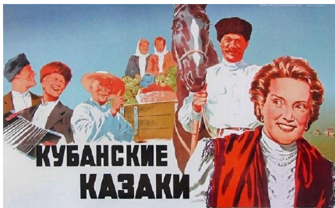
IVAN PIRYEV Cosacos de Kub3n [Kub3nkskiye kazaki] Pelicula, 1949

El canon del Hollywood de la Edad de Oro genera multitud de respuestas en los pa3ses con una potente industria filmica y con un sistema social y pol3tico distinto, cuando no opuesto. As3 ocurre en la India independiente con el cl3sico Pyasa , cuya mezcla entre efectismo y sentimiento define las cualidades de Bollywood, y con la comedia musical sovi3tica, en la que proyectamos Cosacos de Kub3n , 3pica producci3n sobre las granjas colectivizadas y los planes quinquenales.