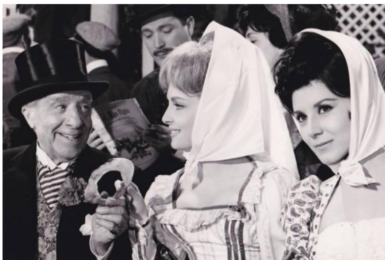
BENITO PEROJO La verbena de La Paloma . Película, 1935

Programa doble que explora otras genealogías para el formato musical dentro de una tradición específicamente española. La doble sesión se sitúa entre el casticismo de la zarzuela ( La verbena de la paloma ) y el arrebatado flamenco de influencia surrealista ( Embrujo ). Ambas películas proponen un idiosincrático musical popular.