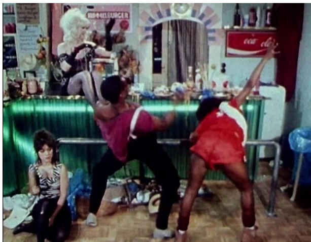
ROSA VON PRAUNHEIM La ciudad de las almas perdidas [Stadt der verlorenen Seelen], Película, 1983

Sesión 14. Rosa von Praunheim. La ciudad de las almas perdidas [Stadt der verlorenen Seelen]. Alemania (República Federal Alemana), 1983, color, VO en alemán con subtítulos en español, 94'