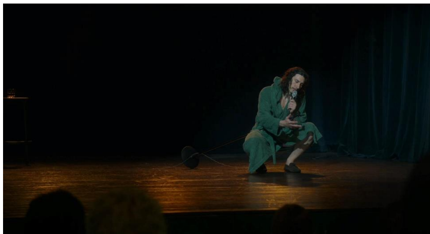
LEOS CARAX Annette . Película, 2021

Sesión 3. Leos Carax. Annette . Francia, Alemania y Bélgica, 2021, color, sonido, VO en inglés con subtítulos en español, 141'