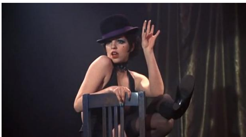
BOB FOSSE Cabaret . Película, 1972

Cabaret el título de uno de los musicales más exitosos del género, pero también un espacio de la noche donde todo tipo de actitudes son permitidas y las normas de la vida convencional son subvertidas. Así ocurre en estas dos películas, la mítica Cabaret , y la underground La ciudad de las almas perdidas . Ambas tratan Berlín y la fiesta mientras el mundo se desmorona.