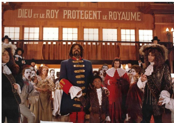
MED HONDO West Indies ou les nègres marrons de la Liberté . Película, 1979

Esta semana los protagonistas son voces y músicas africanas y afro-descendientes. La legendaria actriz y cantante Josephine Baker destaca en el primer largometraje protagonizado por una mujer negra en la historia del cine. Por su parte, el director panafricanista Med Hondo acude al musical, a su gran escenografía y a su delirio narrativo, para contarnos la historia del esclavismo en números corales inolvidables.