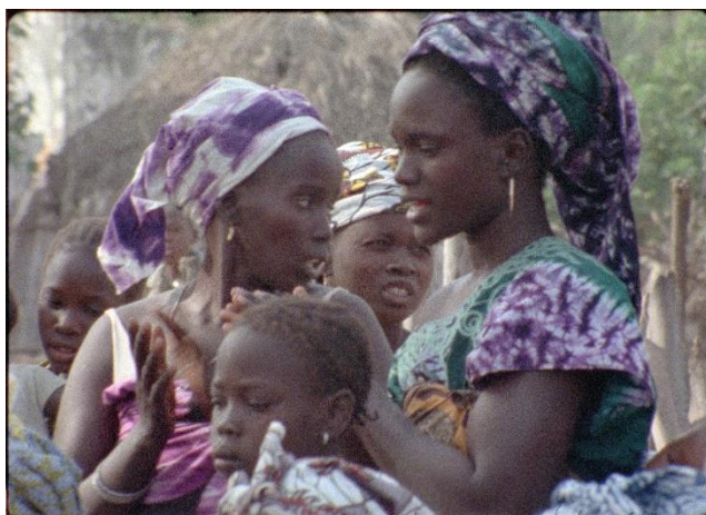
SAFI FAYE. Fad'jal . Película, 1979

Senegal y Francia, 1979, VO en serer con subtítulos en español, 112'