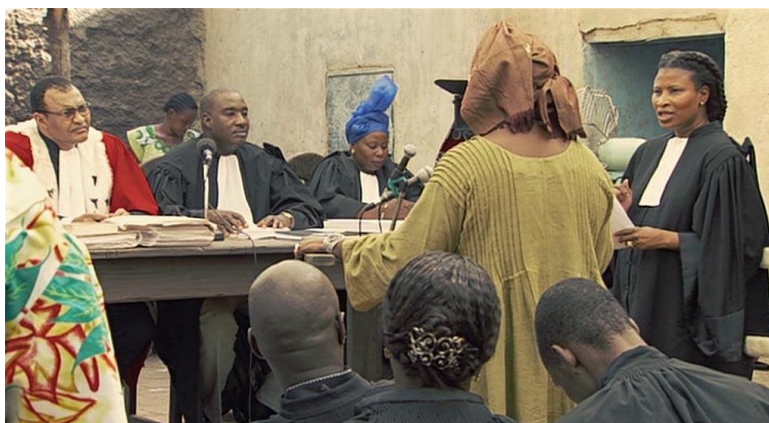
ABDERRAHMANE SISSAKO. Bamako. Película, 2006

A finales de la década de 1980, el Banco Mundial y el Fondo Monetario Internacional quisieron incluir a África en el capitalismo globalizado. Su política exigía que los países africanos abrieran sus mercados al capital internacional, redujeran el gasto gubernamental y privatizaran bienes y servicios.