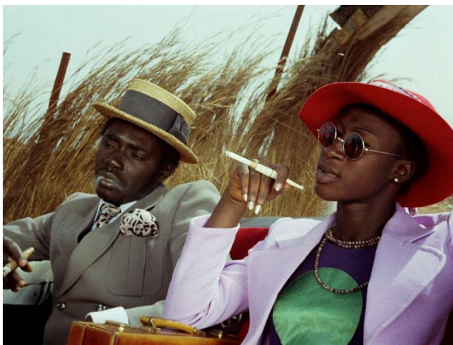
DJIBRIL DIOP MAMBÉTY. Touki bouki . Película, 1973

ha nacido en África. Los instrumentos puede que sean europeos, pero la necesidad creativa y la razón proceden de nuestra tradición oral. Para hacer una película solo tienes que cerrar los ojos y ver las imágenes. Abres los ojos y ahí está la película. Quiero que los niños entiendan que África es una tierra de imágenes [...] debido simple y paradójicamente, a la tradición oral. Y la tradición oral es una tradición de imágenes. Lo que se dice es más potente que lo que se escribe, la palabra se dirige directamente a la imaginación, no al oído. La imaginación crea la imagen y la imagen crea el cine, así que somos por vía directa los progenitores del cine”.