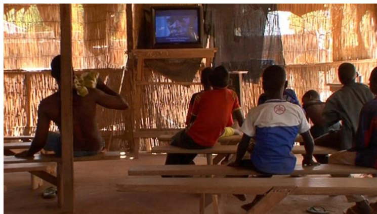
JEAN-MARIE TENO. Lieux saints . Película, 2009

Jean-Marie Teno vuelve a Uagadugú, capital de Burkina Faso, para asistir a FESPACO, el Festival Panafricano de Cine y Televisión, la gran cita del cine africano desde 1969. Pero esta vez decide, invitado por una amiga, residir y filmar en el barrio de St. Léon, donde, entre otras cosas, hay un cine club donde se proyectan copias piratas para los vecinos del