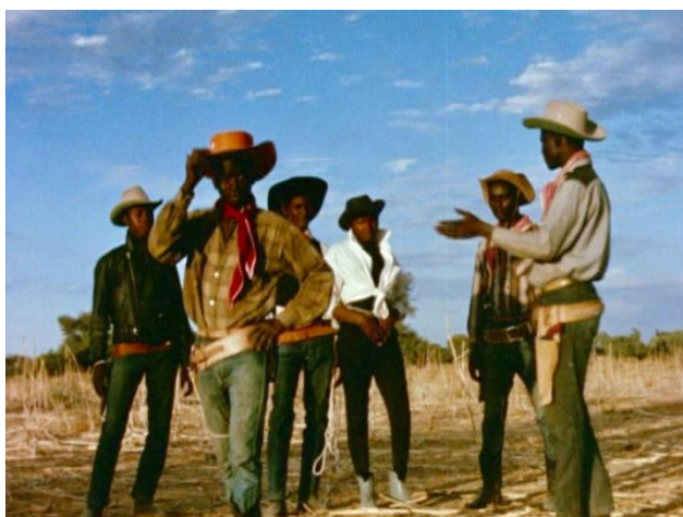
MOUSTAPHA ALASSANE. Le Retour de l'aventurier. Película, 1966

Un año más regresa el cine de verano al Museo Reina Sofía con el ciclo Con las herramientas del amo. Relatos del cine africano , que pretende acercarnos una serie de películas esenciales del cine africano de los países al sur del Sahara, y que se desarrollará en sesiones dobles con presentaciones y diversas actividades durante los viernes y sábado de julio y agosto en el entorno abierto del Jardín histórico del Edificio Sabatini del Museo. El título invierte la frase de la escritora afrofeminista Audre Lorde (Estados Unidos, 1934-1992), las