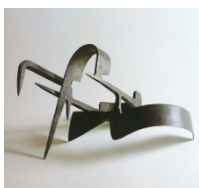
Eduardo CHILLIDA Plano oscuro , 1956 Hierro forjado 23 x 44,4 x 24,2 cms