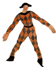
Juan GRIS Arlequín , 1923 Metal recortado y pintado 30 cms (alto)