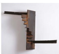
Juan MUÑOZ Sin título , 1982 Hierro 85 x 64,5 x 63 cms