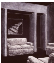
Juan MUÑOZ Raincoat Drawing , 1992-93 Tiza y óleo sobre tela impermeable 125 x 102, 5 cms