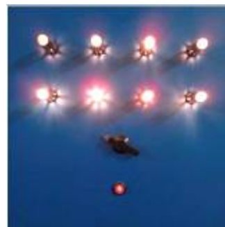
LUGÁN VTL-3 Azul (Siete variaciones tiempo-luz), 1967 Caja de luz y sonido, potenciómetro 50 x 50 x 13 cm 46 x 61 cm

A esta compra hay que sumar otras 5 obras de LUGÁN - Luis García Núñez- (Madrid, 1929), uno de los artistas españoles más originales de los años sesenta y setenta, cuyo trabajo se caracteriza en buena medida por unir constructivismo y dadaísmo, aglutinando en la misma obra los aspectos visuales, táctiles y sonoros. Se ha adquirido un dibujo vinculado al neoplasticismo y dos dibujos y collage -fechados todo ellos en 1962 y 1963- así como las piezas electrónicas Siete variaciones tiempo-luz (1967) y Sin título (1968).