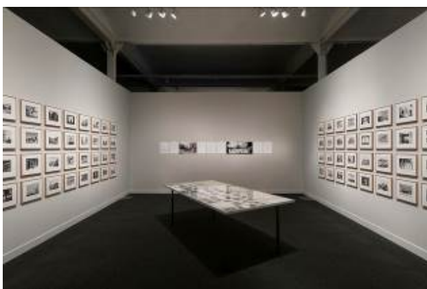
ALEJANDRO S. GARRIDO Corea. A Parallel Story, 2017 Instalación de 88 fotografías enmarcadas, folleto, 16 láminas y mesa con documentación Dimensiones variables

De Alejandro S. Garrido (Madrid, 1986) se ha comprado la obra Corea. A parallel story (2017), una instalación de 88 fotografías y diversa documentación. Su trabajo se basa en la investigación de desarrollos urbanísticos en la España postfranquista, utilizando la fotografía como herramienta documental.