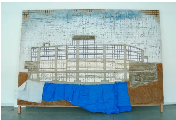
MARWAN RECHMAOUI Blue Building, 2015 Cemento, plástico, acero y pintura Dimensiones variables

Para incidir en la línea de arte internacional, especialmente de artistas no occidentales, que demuestran su capacidad de crítica frente a la sociedad, el Museo ha adquirido la obra Blue Building (2015), de Marwan Rechmaoui (Beirut, Líbano, 1964). El trabajo de este artista se inspira en la geografía y en la complejidad cultural de su ciudad natal, reflexionando sobre la urbanización contemporánea desde un punto de vista social y demográfico, incidiendo en las cuestiones socio políticas y en la historia y la etimología de cada comunidad. En este caso concreto refleja el descontrolado desarrollo urbano de Beirut presenciado directamente por el artista desde su propio estudio al otro lado del río.