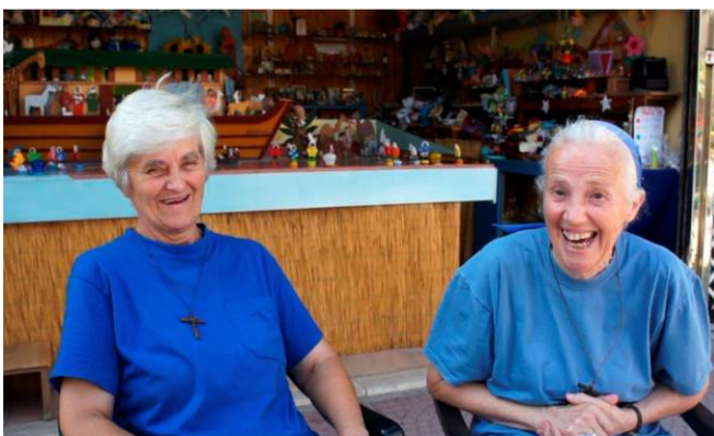
ANDREA BUETTNER Little Sister: Lunapark Ostia, 2012 Vídeo

De Andrea Büttner (Stuttgart, Alemania, 1972) se ha adquirido el video Little Sister. Lunapark Ostia (2012), dos xilografías de 2016 tituladas Beggar y una instalación. Es una artista multidisciplinar cuya obra abarca diversas técnicas pero sobre todo el videoarte y se centra en cuestiones sociales, con un interés particular en las nociones de pobreza, vulnerabilidad, dignidad, religión y los sistemas de creencias que las sustentan.