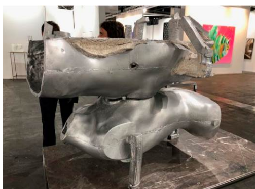
JUNE CRESPO Helmets (2019)

Por primera vez se incorpora a la Colección el trabajo de la singular escultora June Crespo (Pamplona, 1982), distinguida recientemente con diversos premios como el del programa El ojo crítico , de RNE, y la Beca de Artes Plásticas de la Fundación Botín, en 2018. De ella se ha adquirido la escultura Helmets (2019).