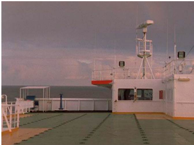
ROSALIND NASHASHIBI Bachelor Machines Part 1, 2007 16mm transferido a vídeo. 31', color, sonido

La película Bachelor Machines Part 1 (2007) es la primera creación que representará dentro de la Colección a Rosalind Nashashibi (1973, Londres), una artista que investiga los rituales o comportamientos sociales grupales y que tiene como lenguaje principal el cine. La temática de esta obra pone en entredicho los modelos de consumo y la historia contemporánea, y aporta discusiones clave del videoarte.