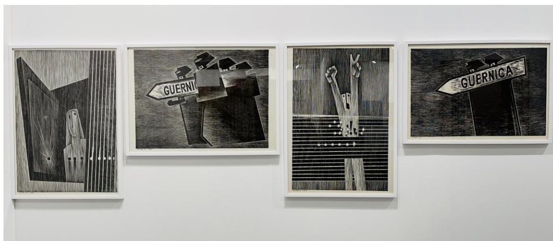
Agustín Ibarrola. Sin título . Década de 1970. Xilografías sobre cartulina. Medidas variables.

La Comisión Permanente del Real Patronato del Museo Reina Sofía, tras la reunión mantenida a primera hora de la mañana de hoy, ha aprobado la adquisición de un conjunto de obras que serán asignadas por el Ministerio de Cultura y Deporte a la colección de este Museo.