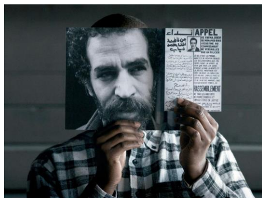
BOUCHRA KHALILI The Tempest Society , 2017 Película digital 2k 60' Edición 2 de 5

Bouchra Khalili (Casablanca, Marruecos, 1975) es una artista franco-marroquí que actualmente vive en Berlín y trabaja en video, fotografía, dibujo e instalación. Estudió cine en la Sorbonne y artes visuales en École Nationale Supérieure de Cergy. A menudo emplea el género del cine documental para redirigir las convenciones por las cuales se pide a los ciudadanos presentarse a sí mismos delante del estado, usando testimonios, retratos y discursos políticos. La artista asume el desafío de desarrollar un planteamiento crítico y ético a cuestiones de ciudadanía, comunidad y agencia política. Ampliamente reconocida a