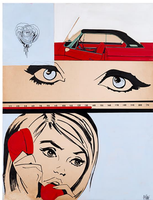
Ana Peters. Cuentaquilómetros , 1966. Acrílico sobre papel encolado a tablex. 130 x 100 cm.

Formó parte del grupo artístico Estampa Popular de Valencia, de raíz antifranquista que optaba por un léxico que hundía sus raíces en el lenguaje del cómic y la publicidad, utilizaban la estampa y la serigrafía como medio de difusión. Pero es en 1990 cuando alcanzó el lenguaje pictórico que la caracteriza, los llamados monocromos, que conformaban ya una tradición arraigada dentro del arte del siglo XX. Inicia así lo que podemos denominar su