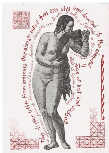
Colectivo Ayllu La can bal (Serie Perrear el dolor) , 2018-2020 Litografía 102 x 72 cm Ed. 10