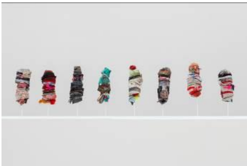
SARA RAMO Minhas e Suas , 2018 (obra en proceso) técnica mixta 11 esculturas. Medidas variables.

Sara Ramo (Madrid, 1975) es una artista hispanobrasileña con una importante presencia en el contexto del arte internacional y latinoamericano. La ausencia de su obra en la Colección del Museo se verá paliada con la presencia de Minhas e Suas (2018, obra en proceso), un grupo de 11 esculturas con