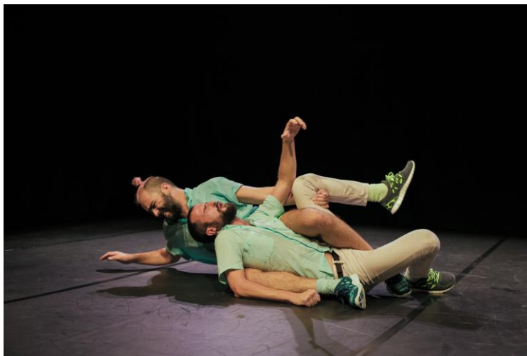
Los micrófonos