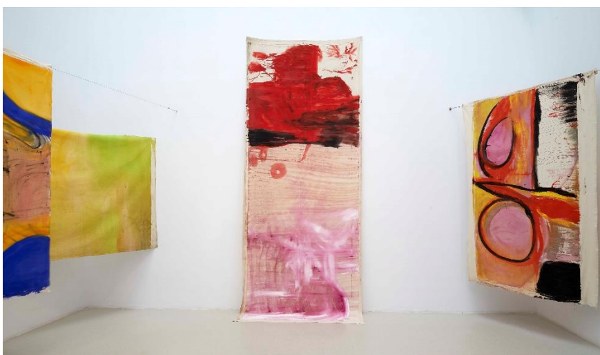
Vista de la exposición de VIVIAN SUTER en el Palacio de Velázquez. Museo Nacional Centro de Arte Reina Sofía. Junio, 2021

En este sentido, en la nave derecha del Palacio, Suter ha colocado en el suelo algunas obras, junto a otras colgadas de cables, que contienen gran cantidad de materia.