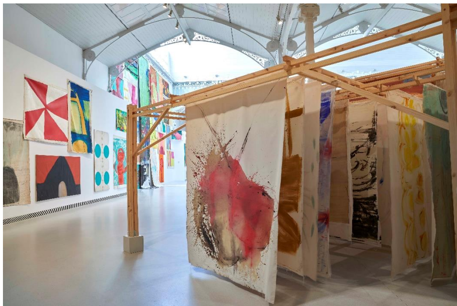
Vista de la exposición de VIVIAN SUTER en el Palacio de Velázquez. Museo Nacional Centro de Arte Reina Sofía. Junio, 2021

El Palacio de Velázquez del Parque del Retiro acogerá desde el 25 de junio de 2021 hasta el 2 de mayo de 2022 una amplia exposición de la artista argentina de origen suizo Vivian Suter (Buenos Aires, 1949). La muestra, organizada por el Museo Reina Sofía, reúne cerca de 500 pinturas , desde algunas de sus grandes obras sobre papel de los años 80 hasta telas realizadas en los últimos meses.