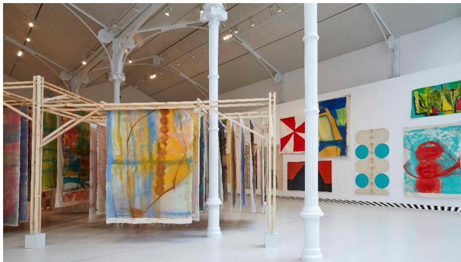
Vista de la exposición de VIVIAN SUTER en el Palacio de Velázquez. Museo Nacional Centro de Arte Reina Sofía. Junio, 2021

La instalación del Palacio de Velázquez ha sido concebida por la propia artista teniendo en cuenta las características arquitectónicas de este singular edificio. La idea es, según Vivian Suter, construir una ruta museográfica donde las telas compongan un sitio habitable que envuelva a quienes visiten la exposición.