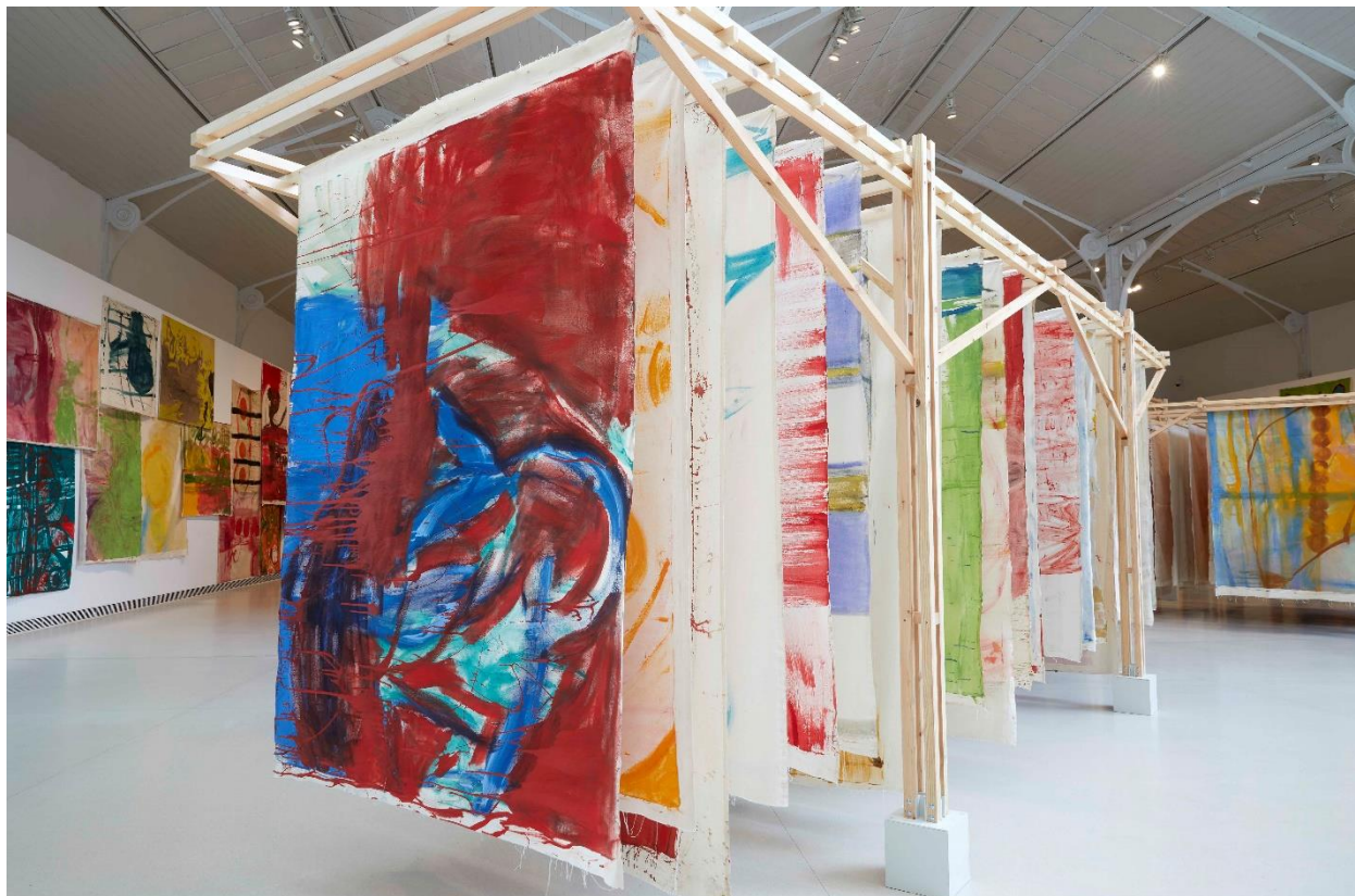
Vista de la exposición de VIVIAN SUTER en el Palacio de Velázquez. Museo Nacional Centro de Arte Reina Sofía. Junio, 2021