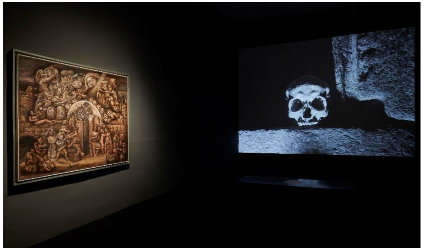
Sala 425. A la izquierda, Trasmundo , de Laxeiro. De frente, imagen de Acariño galaico , de José Val del Omar. COLECCIÓN. Museo Nacional Centro de Arte Reina Sofía. Mayo, 2021

Entre las importantes novedades que presenta ahora la Colección destaca la proyección de la película de José Val del Omar Acariño galaico ( De barro ) (1961-1995), que rodó en Galicia con el propósito de integrarla, junto a Aguaespejo granadino (1953-55) y Fuego en Castilla (1956-59), en un conjunto que llamó Tríptico Elemental de España . Sin embargo, lo dejó inacabado para retomarlo al término de su vida aunque su montaje hubo de ser ultimado finalmente por