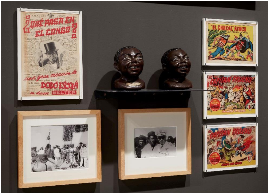
Detalle de la instalación Y coloniales... , de Rogelio López Cuenca COLECCIÓN. Museo Nacional Centro de Arte Reina Sofía. Mayo, 2021

Tras mostrar el fin de la autarquía de España, la Colección pasa a centrarse en los años 60, caracterizados por el desarrollismo y por la campaña propagandística lanzada por el régimen de Franco para conmemorar los XXV Años de Paz desde el final de la Guerra Civil, una amplia campaña en la que se difundió el concepto de paz como sinónimo de prosperidad económica y estabilidad política. Las exposiciones, festivales, concursos, publicaciones y estrenos cinematográficos que se organizaron pretendían dar una imagen moderna del país.