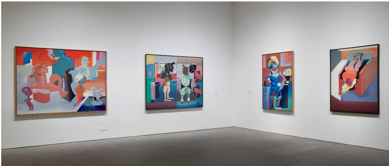
Sala 428. De izquierda a derecha: La familia, Adán y Eva, Caballero cubista aux larmes y Señor blanco en lugares sólidos , de Luis Gordillo COLECCIÓN. Museo Nacional Centro de Arte Reina Sofía. mayo, 2021

generación, como las situadas en torno al Equipo Crónica, quienes han debido esperar a investigaciones recientes para visibilizar sus trabajos. Dentro del significativo incremento de mujeres artistas que va a mostrar la Colección, que ha incorporado un importante conjunto de obras en esta materia en los últimos años, la sala Mujeres, Arte y Tardofranquismo reúne así trabajos del arte conceptual de Eulàlia Grau (1946, España) o de otras autoras pop como Mari Chordà (1942, España), Ángela García Codoñer (1944, España) o Isabel Oliver (1946, España).