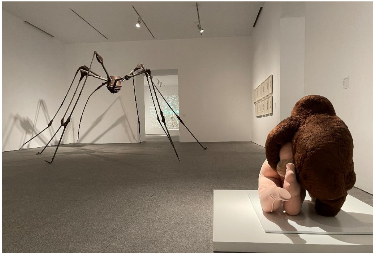
Sala 419. Al fondo, Araña , de Louise Bourgeois . En primer término, Abrazo , de Dorothea Tanning COLECCIÓN . Museo Nacional Centro de Arte Reina Sofía. Mayo, 2021

El Museo Reina Sofía presenta nueva Colección cuando acaban de cumplirse los treinta años del nacimiento del Museo. A lo largo de su aún breve historia ha habido varias reordenaciones parciales, algunas veces acotadas a determinadas salas o proponiendo nuevas lecturas de autores o periodos. Después de la reordenación del 2010 ahora la propuesta supone una relectura integral, que afecta a la Colección al completo incluyendo el arte más reciente desde los ochenta hasta hoy.