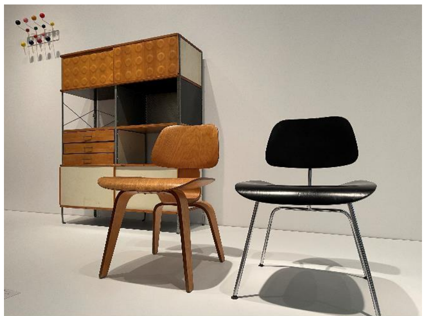
Vista de la sala 411, con obras de Charles y Ray Eames . COLECCIÓN . Museo Nacional Centro de Arte Reina Sofía. Mayo, 2021

Esta primera presentación de Colección comienza con una novedosa interpretación del contexto del arte y la cultura estadounidenses tras la Segunda Guerra Mundial, cuando el país se consolida como primera potencia mundial y propaga su hegemonía cultural, encarnado en el modo de vida americano ( American Way of Life ). El paradigma de esta visión la personificaría el matrimonio Eames: Charles Eames (1907-1978, EE.UU) y Ray Eames (1912-1988, EE.UU), una pareja de arquitectos y diseñadores que moldeó en los años 40 y 50 el