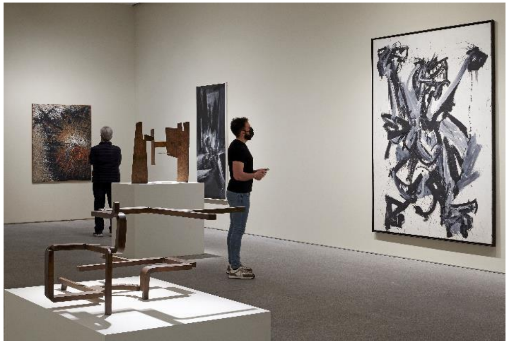
Sala 420. Obras de Juana Francés , Chillida , Martín Chirino , Manuel Viola y Antonio Saura . COLECCIÓN. Museo Nacional Centro de Arte Reina Sofía. Mayo, 2021

significó el triunfo en España de las tendencias abstractas y su reconocimiento oficial por parte del régimen, que empezó a promover el arte de vanguardia del país. En esta sala, además del cuadro de Mark Rothko (1903, Letonia - 1970, EE.UU), autor que estuvo en la exposición americana en España, podemos