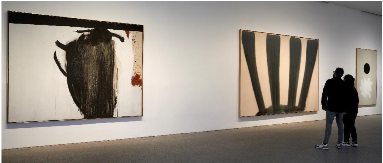
Vista de la sala 411. De izquierda a derecha, obras de Motherwell ( Figura totémica ), Morris Louis ( Corona ) y Gottlieb ( Negro más blanco ) COLECCIÓN . Museo Nacional Centro de Arte Reina Sofía. Mayo, 2021

Durante esa época EE.UU apoya de manera decidida la cultura a través de la organización de todo tipo de exposiciones internacionales que aprovecha para hacer propaganda ideológica durante la Guerra Fría. La Exposición Nacional Estadounidense, celebrada en Moscú en 1959, supuso un importante momento en la promoción del estilo de vida americano, mostrando automóviles, televisores, aspiradoras, electrodomésticos, etc. La muestra propició el célebre debate Nixon-Jrushchov en la TV americana, conocido como el “debate de cocina”, donde se contrapusieron los modos de vida soviético y americano, y que se expone en esta primera sección, además de fotografías de la Exposición Nacional Estadounidense y diversos electrodomésticos del periodo, depósito de la colección Autric-Tamayo