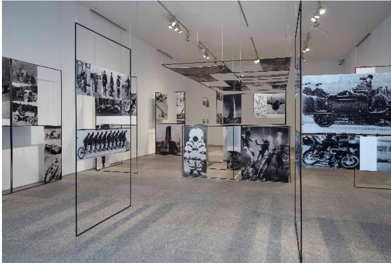
Vista de la sala 413 con la obra de Richard Hamilton , Hombre, Máquina y Movimiento . COLECCIÓN. Museo Nacional Centro de Arte Reina Sofía. Mayo, 2021

1953 por Öyvind Fahlström (1928, Brasil-1976, Suecia), que refleja el interés en Europa por la creación de nuevos lenguajes aunando elementos tomados de la poesía visual, y en sintonía con la herencia surrealista.