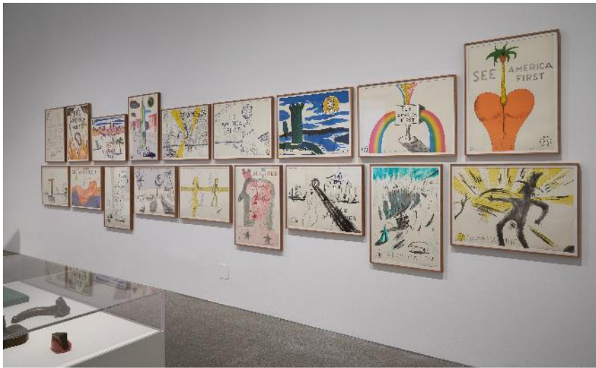
Sala 421. See America first , de H.C. Westerman COLECCIÓN. Museo Nacional Centro de Arte Reina Sofía. mayo, 2021

Se expone la imponente Araña de Bourgeois, realizada en 1994 que se relaciona con la idea de la casa y del espacio interior, habitado por la mujer, pero de un modo completamente distinto al paradigma americano de la mujer. De Dorothea Tanning se muestran diferentes piezas incorporadas a la Colección tras la muestra el Museo le dedica en 2018 y que ha permitido construir un relato donde destaca la escultura Abrazo (1969), una pieza de marcado carácter antiformal. En ambas artistas, el espacio interior, la habitación o la casa -aclara Peiró- es reivindicado como espacio mental y onírico en el que construir una nueva identidad más allá de las limitaciones del género. Era de esperar que trabajos tan radicales no fueran totalmente entendidos en una América conservadora y puritana, ni en un medio artístico cuya prevalencia por lo óptico era definitoria.