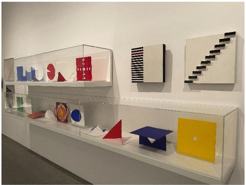
Obras de Lygia Pape en la sala 415 (en las vitrinas, Libro de la creación ) COLECCIÓN. Museo Nacional Centro de Arte Reina Sofía. Mayo, 2021

Se reivindica también el papel del libro dentro de la creación plástica, que desborda los límites del cuadro, como en El libro de la creación (1959) de Lygia Pape (1927-2004, Brasil), una reinterpretación del Génesis a través de formas geométricas.