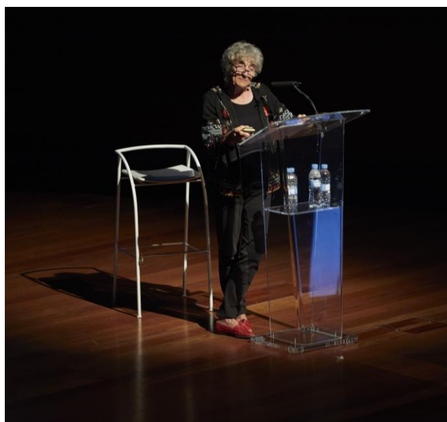
Lucy Lippard durante una conferencia en el Museo Reina Sofía Actividad desarrollada por el Centro de Estudios del Museo Reina Sofía

Lejos de acotar su programa a conferencias magistrales, las Cátedras proponen combinar distinto tipo de actividades públicas comisariadas por reconocidos especialistas de prestigio internacional (por ejemplo, Rita Segato) con un trabajo sostenido durante todo el año, a través de seminarios, grupos de lectura y/o encuentros con investigadores especializados en las materias que enmarcan estos espacios.