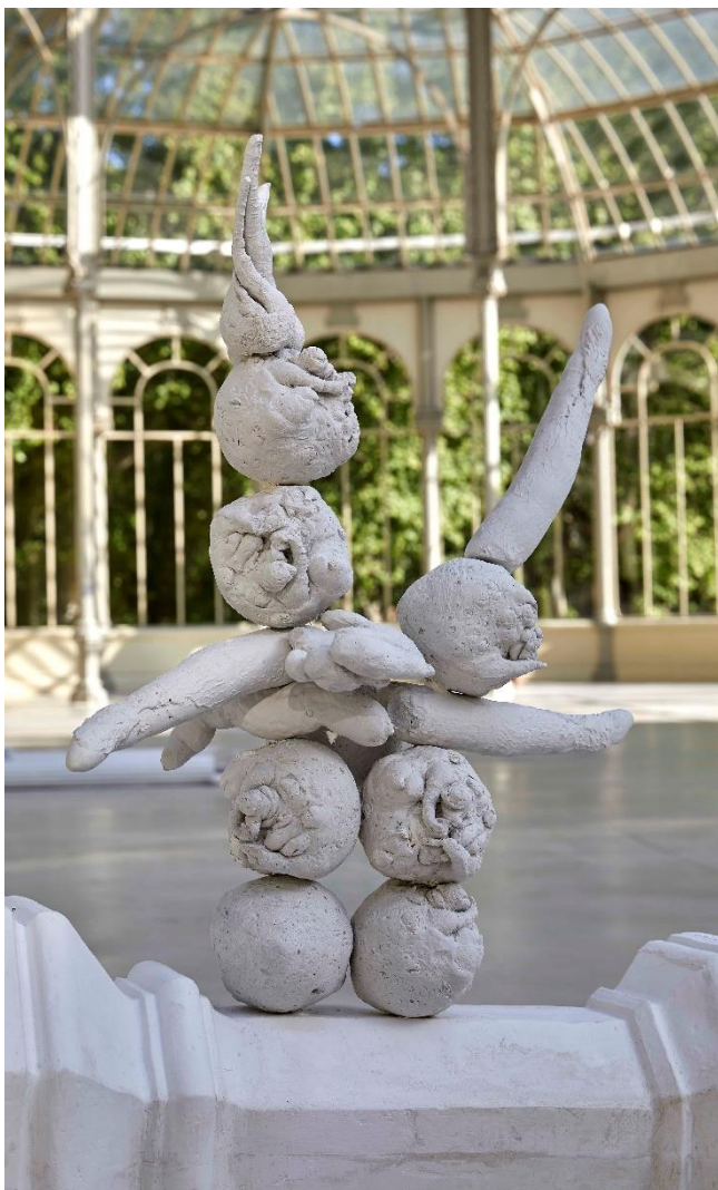
Detalle de la exposición PEP AGUT. Meridiano de Madrid: sueño y mentira , en el Palacio de Cristal. Abril, 2021 Museo Nacional Centro de Arte Reina Sofía Archivo fotográfico del Museo Reina Sofía

El Museo Reina Sofía presenta Meridiano de Madrid: sueño y mentira , un proyecto de Pep Agut (Terrassa, 1961), creado específicamente para el Palacio de Cristal del Parque del Retiro, en el que el artista reflexiona sobre el contexto histórico en el que fue construido el Palacio (diseñado por Ricardo Velázquez Bosco) entre los años 1884 y 1887 para la Exposición General de las Islas Filipinas e inspirado en el Crystal Palace de Joseph Paxton de Londres (1851).