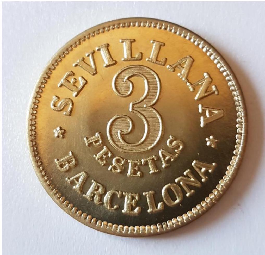
PEDRO G. ROMERO La Sevillana (La farsa monea) , 2017. Pieza producida por dokumenta 14 © Pedro G. Romero