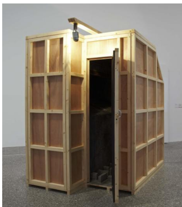
PEDRO G ROMERO Archivo F.X. y reproducción de la checa del SIM (Servicio de investigación militar) del convento de la calle Zaragoza de Barcelona en 1937, 2009 Madera de pino, acrílico, bombilla, reproductor de audio y altavoces © Pedro G. Romero

En cuanto a Archivo F.X. , el proyecto nació como una reflexión sobre el fin del arte y constituye un amplio conjunto de trabajos en torno a la imagen y la iconoclastia que fue redefiniéndose en distintos ciclos —Política, Economía, Esthesis—.