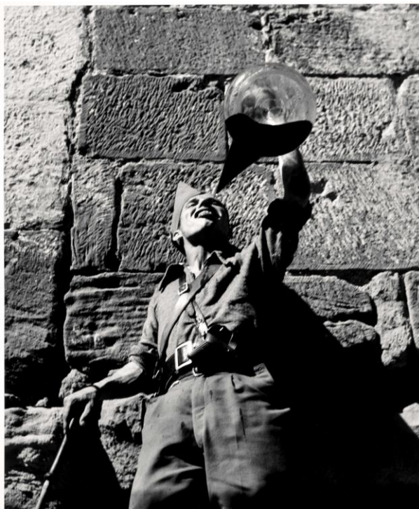
GERDA TARO Miliciano, frente de Aragón , agosto 1936 (Copia póstuma 1998) Gelatinobromuro de plata sobre papel 39,8 x 32,6 cm Donación de Cornell Capa, 1998