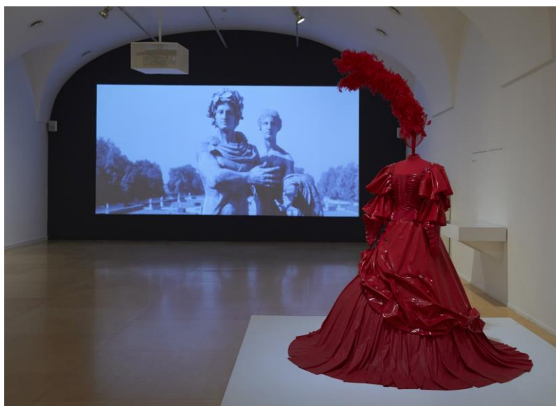
Vista de sala de la exposición Musas insumisas. Delphine Seyrig y los colectivos de vídeo feminista en Francia en los 70 y 80 Museo Nacional Centro de Arte Reina Sofía. Septiembre, 2019.