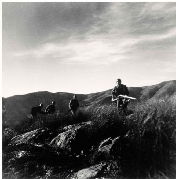
GERDA TARO Soldados republicanos, frente de Málaga , 1937 (copia póstuma 1998) Gelatinobromuro de plata sobre papel 33,2 x 32,6 cm Donación de Cornell Capa, 1998