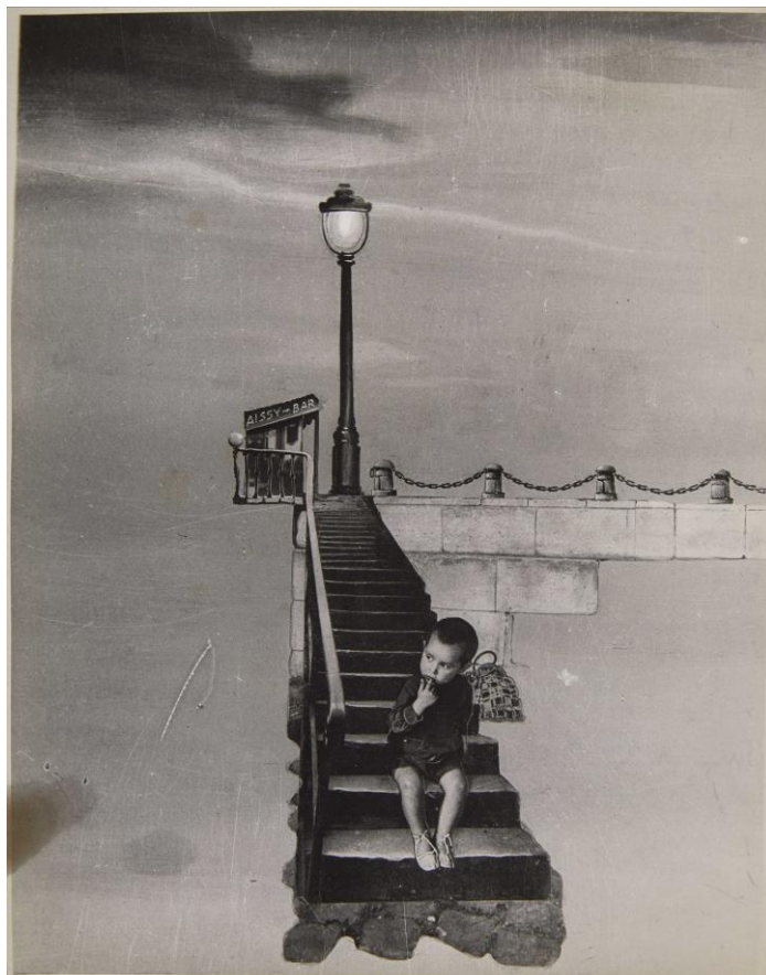
KATI HORNA La infancia , 1939 (copia posterior) Gelatinobromuro de plata y fotomontaje sobre papel 23,5 x 18,3 cm

Con el final de la guerra, Horna tuvo que exiliarse junto a su marido, el español José Horna, y en 1939 se trasladaron definitivamente a Ciudad de