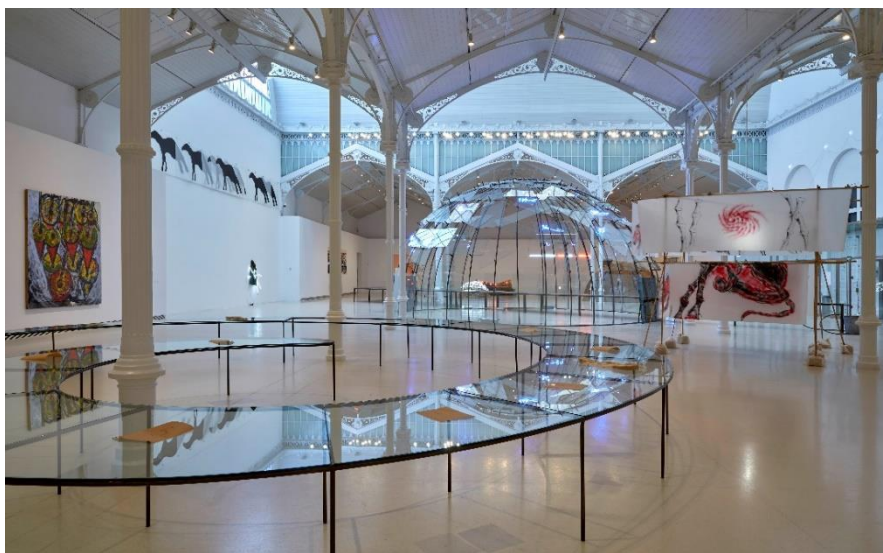
Vista de sala de la exposición Mario Merz. El tiempo es mudo . Palacio de Velázquez. Octubre, 2019. Museo Nacional Centro de Arte Reina Sofía.

La recreación de las figuras de animales de reminiscencias prehistóricas con las que Merz pretendía regresar a un tiempo y a un espacio míticos, están representadas en obras como Rinoceronte (1979) o Piccolo caimano (Caimán pequeño, 1979). Otra idea que asoma en trabajos como Noi giriamo intorno alle case o le case girano intorno a noi? (¿Las casas giran a nuestro alrededor, o giramos nosotros alrededor de las casas?, 1982) o Casa sulla foresta (Casa en el bosque, 1989), es la referida a que todo ese proceso industrial y de consumo había transformado el hogar en una prolongación del espacio laboral. Senza titolo (Sin título, 1984) muestra otro de los motivos artísticos recurrentes en la obra de Merz: los conos y las formas de lanzas alusivas al movimiento y a la trayectoria de un desplazamiento. La obra está realizada sobre una tela pegada a un trozo de madera de grandes dimensiones que formaba parte de los muros del estudio del artista. Allí pintó y garabateó esta pieza, hasta que un día fue arrancada de la pared y adquirió una condición nómada.