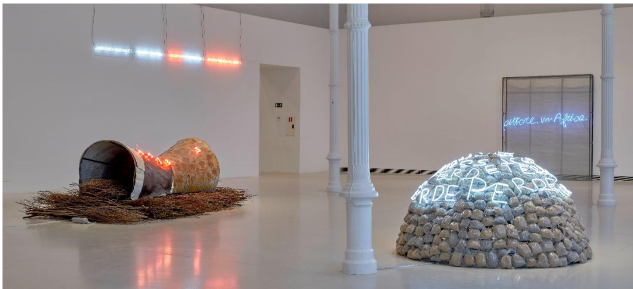
Vista de sala de la exposición Mario Merz. El tiempo es mudo . Palacio de Velázquez. Octubre, 2019. Museo Nacional Centro de Arte Reina Sofía.