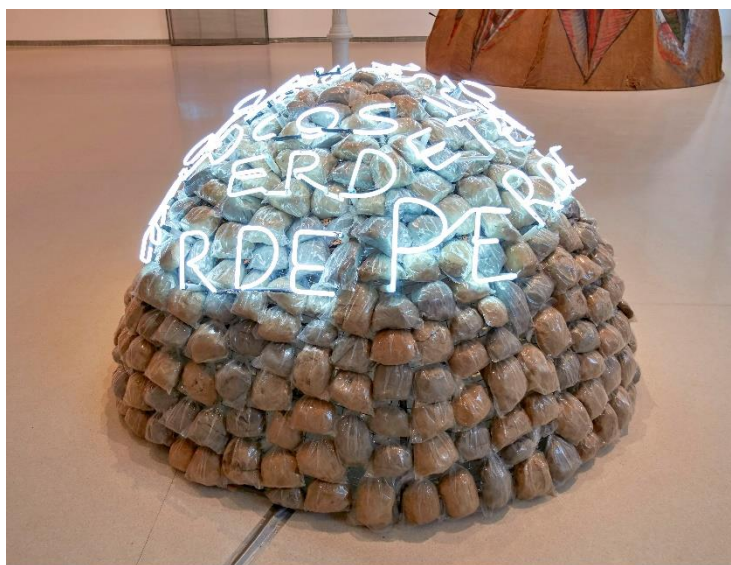
Mario Merz. Iglú de Giap . 1968 Hierro, bolsas de plástico, barro y neón. 120 cm altura x 200 cm diámetro Musée national d'art moderne/Centre de création industrielle Centre Pompidou © Mario Merz by SIAE, VEGAP, Madrid, 2019

Las creaciones artísticas de Merz más características y reconocibles son sus innumerables variaciones de la estructura de la cabaña arcaica y el iglú , con su forma abovedada. Son construcciones que evocan toda una serie de referencias y recuerdos de las cabañas primitivas de los inicios de la historia humana, además de habitáculos temporales y proyectos utópicos del mundo posindustrial. Estas creaciones recuerdan a los inicios de la arquitectura y la historia de las construcciones indígenas, que siguen levantándose y utilizándose en distintas partes del mundo. Los iglús de Merz no se construyen con nieve, sino con desperdicios y material encontrado del mundo industrial, por lo general vidrio. Algunos