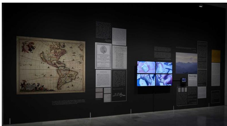
Vista de la exposición MAPA TEATRO. De los dementes, ò faltos de juicio . Museo Nacional Centro de Arte Reina Sofía. Octubre, 2018.

Esta “etno-ficción” parte de una investigación sobre el pasado histórico del edificio del Museo que fue sede del Hospital General y de la Pasión de Madrid . Fundado en el siglo XVI por el rey Felipe II, este refugio dedicado a la hospitalidad (asistencia a los pobres y marginales de la ciudad), tardaría dos siglos más en convertirse en un centro