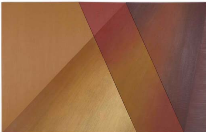
LEE LOZANO Lean [Inclinar], 1966 Óleo sobre lienzo 3 paneles, 198,8 x 312,9 cm en total The Estate of Lee Lozano. LOZAN30686

A partir de mediados de los 60, la obra de Lozano se vuelve más abstracta y minimalista. Figuras geométricas atraviesan lienzos y paneles de margen a margen. La artista utilizaba los colores para provocar emociones, y reflexionaba sobre la idea de las “pinturas de energía” en obras como Big Circle , cuyos segmentos circulares crean efectos ópticos. Una estela surca la profundidad del espacio como lo haría un cohete en ascensión, el recorrido de un arco, la matriz de un círculo o la disolución de la luz en los cuerpos sólidos. Su trabajo se centra ahora en la espacialidad, en un intento por plasmar la cuarta dimensión en esas obras que llevaron a la artista a la conceptualización de su práctica pictórica entre 1969 y 1970. Sus pinturas y estudios perforados se basan en cálculos matemáticos y son un buen ejemplo de su método de trabajo riguroso y preciso.