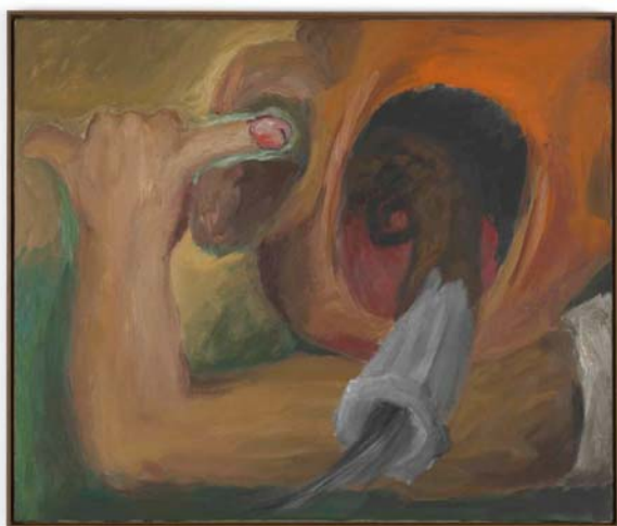
LEE LOZANO Sin título, ca. 1962 Óleo sobre lienzo 81 x 96 cm The Estate of Lee Lozano. Cortesía de Hauser & Wirth LOZAN30713

artista se nutre de su entorno próximo, poblando sus dibujos de motivos inconexos procedentes de su estudio. La manera extraña en que éstos flotan en el espacio y el trazo expresionista e impulsivo que casi es una tachadura identifican estas caóticas composiciones reminiscentes del automatismo surrealista. La ligazón entre el cuerpo y la comida, objeto de varios dibujos, evidencia un particular sentido del humor, reforzado por irónicas locuciones. Son imágenes repletas de partes del cuerpo aisladas: bocas con amplias sonrisas, dientes, penes erectos y pechos, agrupadas de diferentes maneras, y en espacios en los que se retuercen creando una sensación de claustrofobia.