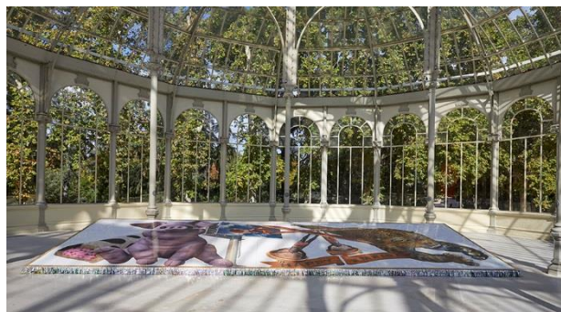
Vista de sala de la exposición Hassan Khan. Las llaves del reino . Palacio de Cristal. Octubre, 2019. Museo Nacional Centro de Arte Reina Sofía.

Dos banderas impresas con los nombres de las obras, situadas en el exterior del Palacio, abren el recorrido de la muestra dando paso a The Keys to the Kingdom , 2019, trabajo que da título a la exposición y que ocupa casi todo el espacio central del recinto. Se trata de un conjunto de 16 banderas de colores con sus mástiles, todas ellas bordadas sobre raso por