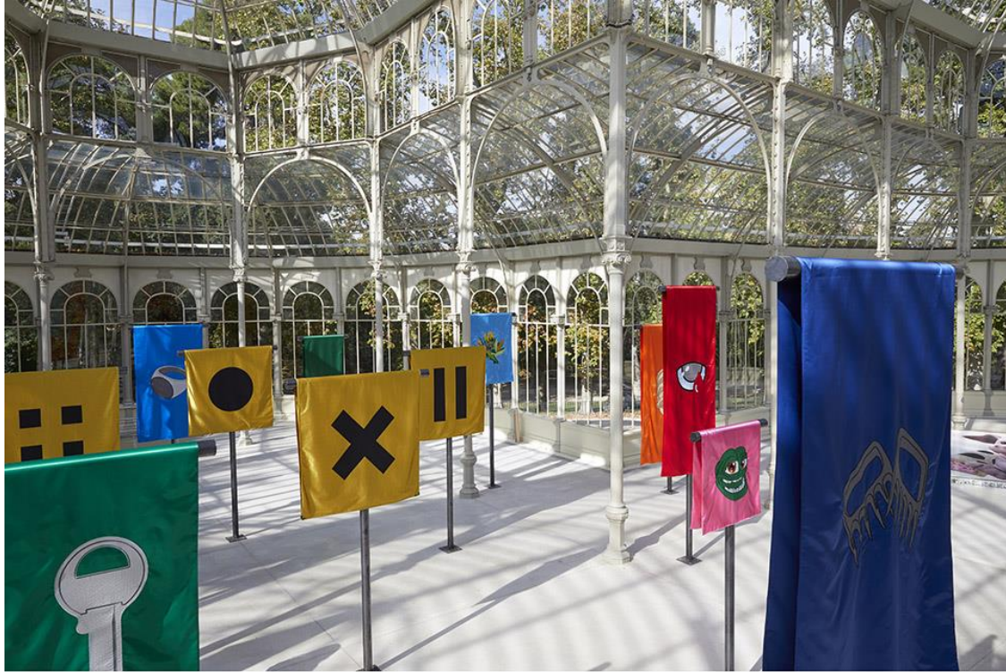
Vista de sala de la exposición Hassan Khan. Las llaves del reino . Palacio de Cristal. Octubre, 2019. Museo Nacional Centro de Arte Reina Sofía.

FECHAS: 17 de octubre de 2019 – 1 de marzo de 2020