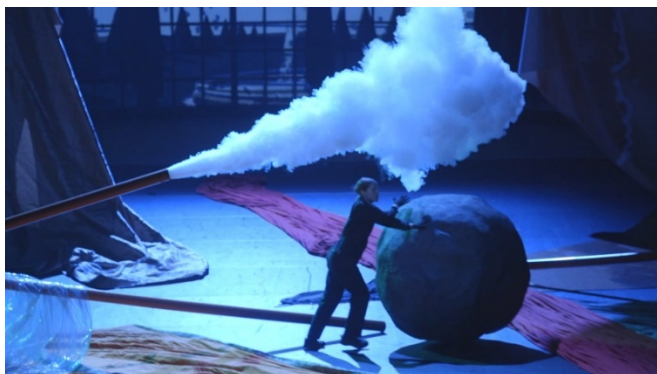
HEINER GOEBBELS The Last Painting , 2019/2023 [La última pintura] Un canal de vídeo, 5 canales de sonido. Color. 20' Colección del artista

Tras la instalación de Bekolo, y en alusión a la noción de Capitalismo Mundial Integrado adoptada por Guattari, se presenta la obra The Last Painting , nueva producción del compositor y director musical alemán Heiner Goebbels . En un escenario de ambientación industrial, un grupo de performers arrastra las reliquias de cuatrocientos años de historia europea fuera de los almacenes del pasado.