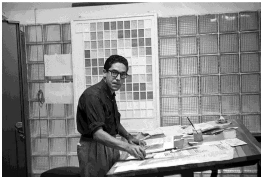
Carlos Cruz-Diez en su taller de diseño. Revista Momento, Caracas, 1957

Su trabajo en este campo influyó de manera importante en el desarrollo de la industria editorial venezolana, contribuyendo a que pasara de ser un sector de técnicos (tipógrafos, diagramadores e