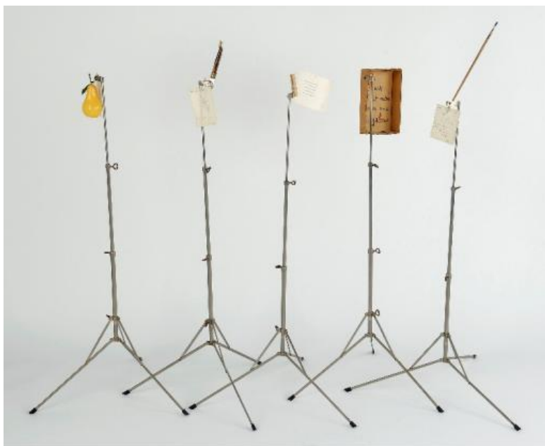
ROBERT FILLIOU Musical Economy No. 5 [ Economía musical nº 5 ], ca. 1971 Técnica mixta Dimensiones variables Musée d'Art Moderne et Contemporain de Saint-Étienne Métropole © Marianne Filliou. Fotografía: Yves Bresson/Musée d'Art Moderne et Contemporain de Saint-Étienne Métropole

Las últimas salas de la exposición explican cómo en los años 70, la convergencia del arte y del sonido comenzó a caminar cada vez más hacia nuevas manifestaciones, como los trabajos de Hanne Darboven o de la española Elena Asins que, con sus rigurosos estudios sobre estructuras armadas a partir de una multiplicidad de elementos finitos, quiso rendir homenaje a las composiciones de Mozart, como los que se muestran de su serie de obras Strukturen .