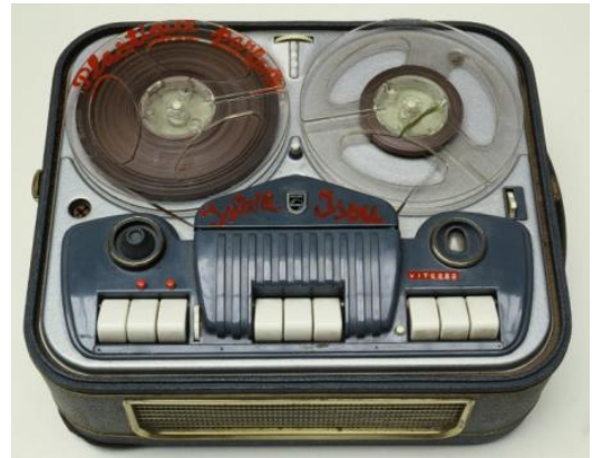
ISIDORE ISOU La plastique parlante , 1960-1987 Técnica mixta 19 x 40 x 34 cm Colección Fabre

La siguiente sala gira alrededor de la grabadora de cinta magnética, un dispositivo utilizado por los artistas para experimentar. Gracias a la posibilidad de manipulación de las bandas con superposiciones, cortes y regulaciones de velocidad, el británico Brion Gysin trabajó, por ejemplo, en la transposición de la técnica de cut-up o de recortes a sus poesías visuales y sonoras, como puede escuchar el público en la interpretación grabada de I Am That I Am (comenzado hacia 1958), poema basado en la frase bíblica Yo soy el que soy .