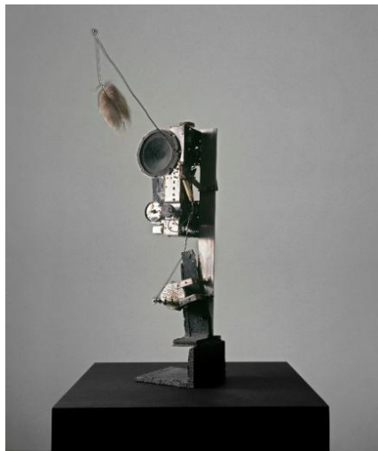
JEAN TINGUELY Radio Skulptur ( Radio escultura ), 1962 Radio y piezas de inserción, cable, pluma de ave y motor eléctrico 90 x 30 x 25 cm Museum Tinguely, Basel. Compromiso cultural de Roche.

El siguiente espacio de Disonata muestra diversos instrumentos, máquinas, estructuras y esculturas que cuestionan la distinción entre arquitectura y artes plásticas, por un lado, y la música, el teatro y similares, por otro.