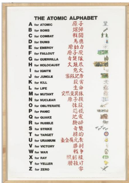
CHRIS BURDEN The Atomic Alphabet (El alfabeto atómico) , 1980 Fotograbado 137.2 x 91.4 cm Whitney Museum of American Art, New York Compra con fondos de Print Committee 2003.110

A su vez, Józef Robakowski y Ulises Carrión se afanaron en sus películas para seguir el ritmo de fenómenos que son similares a sucesos sonoros, como contar en voz alta estando en movimiento o las revoluciones sucesivas de un disco en reproducción; muestra de ello, 45 revoluciones por minuto , un video de Carrión que puede ver el público.