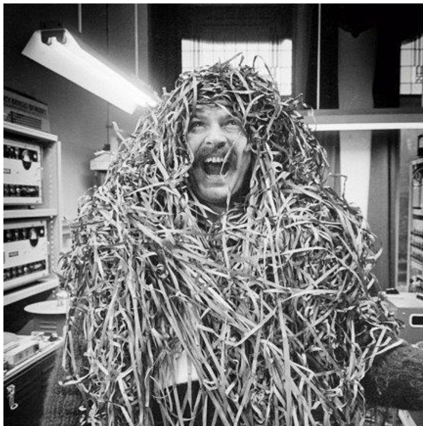
Karel Appel en Phonogram Studio, durante el desarrollo del proyecto Musique barbare [Música bárbara], 1963. Fotografía en blanco y negro.