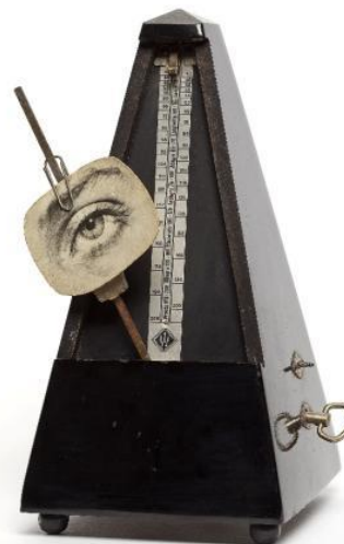
MAN RAY Indestructible object (Objeto indestructible) , 1923 (1965) Metrónomo y fotografía 22 x 11 x 11 cm Colección particular, con la colaboración de la Fondazione Marconi, Milán

Junto a Erratum Musical , de Marcel Duchamp , paradigma de procesos aleatorios en composiciones musicales, otras iniciativas tempranas de arte sonoro que se recogen en esta primera sala son las obras de Man Ray Emak Bakia (Déjame en paz, 1926) , un instrumento que se niega a sonar, y Objeto indestructible , un metrónomo con ojo que supone un reconocimiento de la duración de la labor artística. También se proyecta la película de la vanguardia rusa Entusiasmo: La Sinfonía de Donbass (1930) , de Dziga Vertov , que incluye en su banda sonora ruidos de la fábrica y de la industria minera.