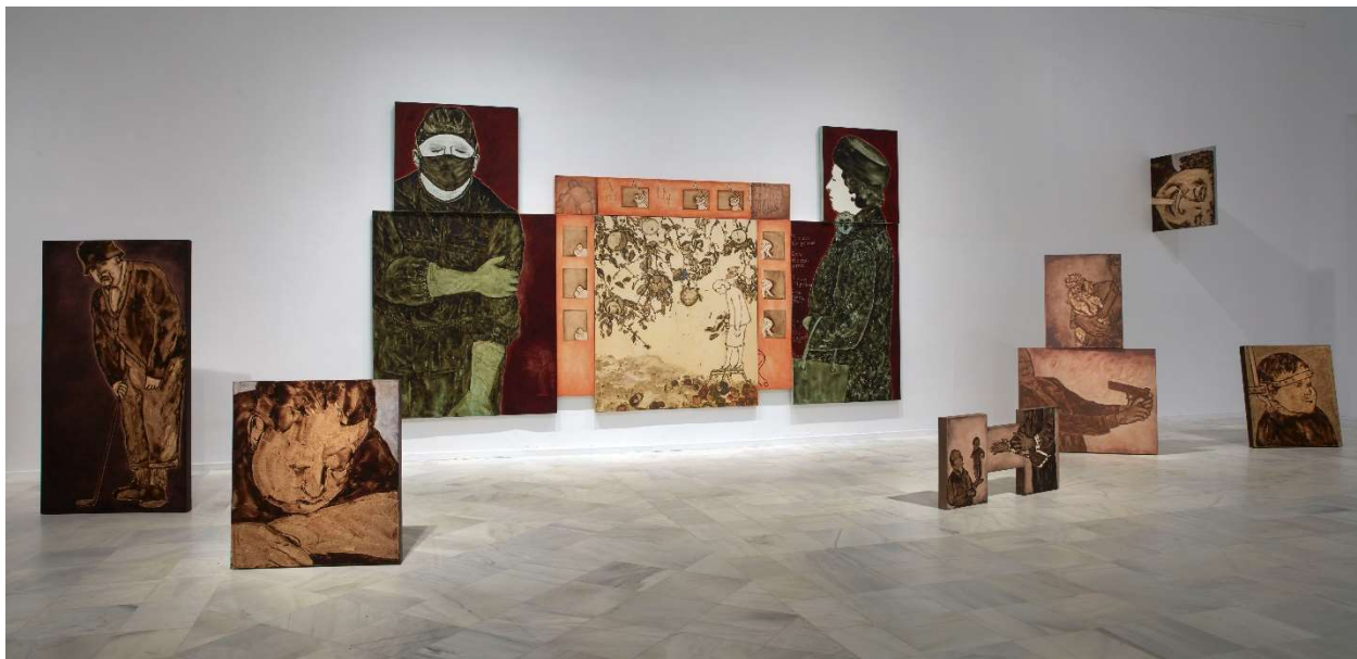
Exposición IDA APPLEBROOG. Marginalias . Museo Nacional Centro de Arte Reina Sofía. Mayo, 2021 Vista de sala