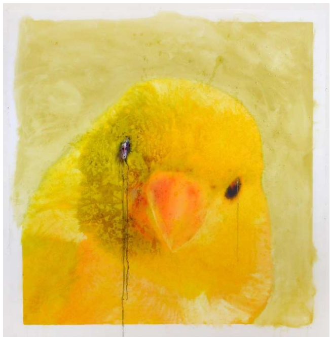
IDA APPLEBROOG Portraits (Canary) Retratos (Canario) , 2019 127 x 121,9 cm. Colección particular

La exposición se cierra con una última instalación, Angry Birds of America (Aves enfadadas de América) , un proyecto iniciado en 2016 que responde al interés de Applebroog por la ornitología, a su permanente cuestionamiento en torno a la investigación científica, e incluso a la situación política de la era Trump. En los últimos cinco años la artista ha dibujado, pintado y modelado pájaros de diversas especies inspiradas en el libro de láminas Birds of America realizadas en el siglo XIX por el naturalista estadounidense John James Audubon.