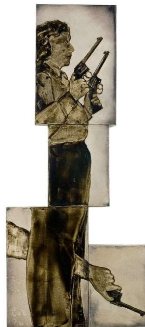
IDA APPLEBROOG Woman and Three Guns (Mujer y tres pistolas) , 1992 Óleo y gel de resina sobre lienzo 163,1 x 71,7 x 7,9 cm Colección particular, cortesía de Hauser & Wirth

Vista en conjunto, y como explica Soledad Liaño, “la práctica artística de Ida Applebroog es sobre todo un medio para interactuar con la realidad y hacernos partícipes de una representación maquiavélicamente orquestada de la vida. Nos cede sin embargo la responsabilidad y voluntad de decidir qué rol queremos desempeñar en ella. La versatilidad plástica de su trayectoria se debe a la resistencia de la artista a ser encorsetada en clichés de discursos hegemónicos y unívocos. La obra de Applebroog ofrece enfoques muchos más amplios y coyunturales que retratan la máquina social en toda su complejidad”.