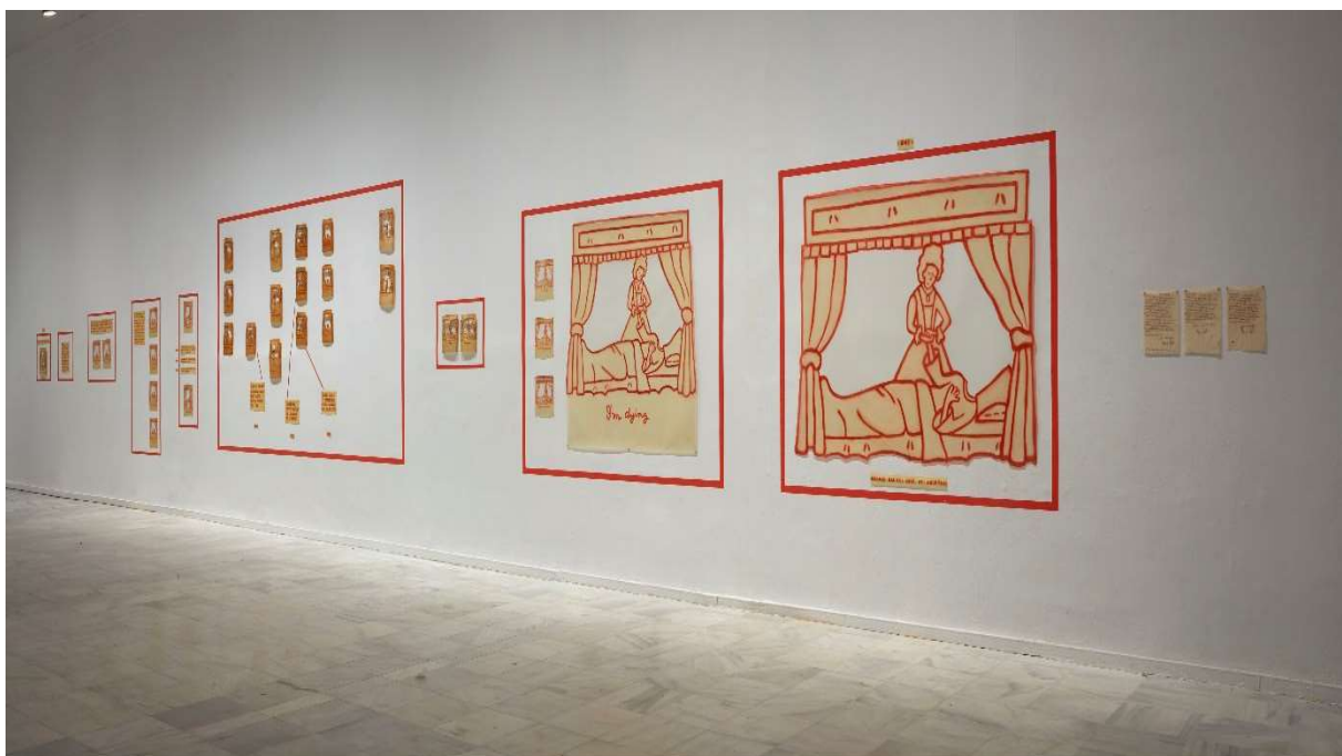
Exposición IDA APPLEBROOG. Marginalias . Museo Nacional Centro de Arte Reina Sofía. Mayo, 2021

Estos teatrillos de pergamino derivaron en escenarios de mayor escala que pronto alcanzaron el tamaño de las ventanas reales. En su algunos de ellos, el espectador podrá escudriñar aquí escenas privadas, domésticas, como en Trinity Towers (1982) que muestra el drama solitario de los primeros casos de VIH en Estados Unidos desencadenantes de cientos de suicidios