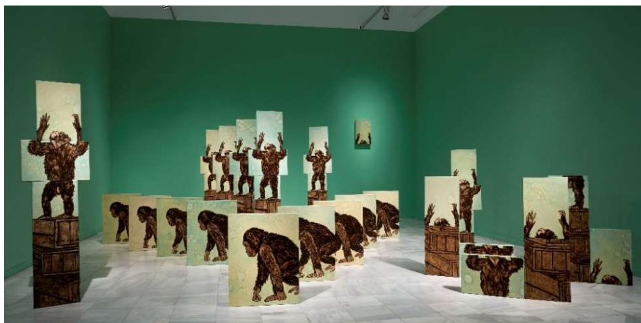
Exposición IDA APPLEBROOG. Marginalias . Museo Nacional Centro de Arte Reina Sofía. Mayo, 2021 Vista de sala con la obra Everything is Fine .

En este mismo contexto se muestra otra instalación que