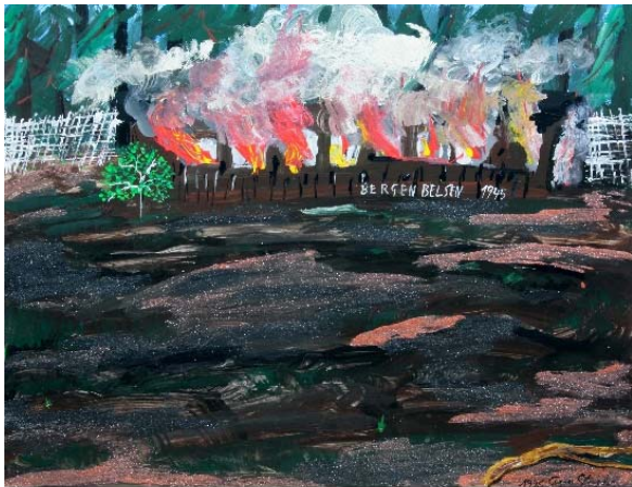
CEIJA STOJKA Bergen-Belsen 1945, 1996 Acrílico y arena sobre cartón 50 x 65,5 cm Colección particular, París.

Entre otros siniestros personajes destaca la Oberaufseherin (vigilante) Dorothea Binz, que bien podría ser la figura rubia y uniformada que aparece en el centro de un pasillo en Sin título (2001). Frente a estos amenazantes personajes están sus víctimas, retratadas con pinceladas rápidas, como apariciones fantasmales sin contornos definidos. Sin embargo, la vida parece residir en los deportados en sus coloridas ropas, como en el asombroso coro de figuras de Frauen Lager Ravensbrück ( Mujeres del campo de Ravensbrück , 1993) en la frontera entre lo figurativo y lo abstracto.