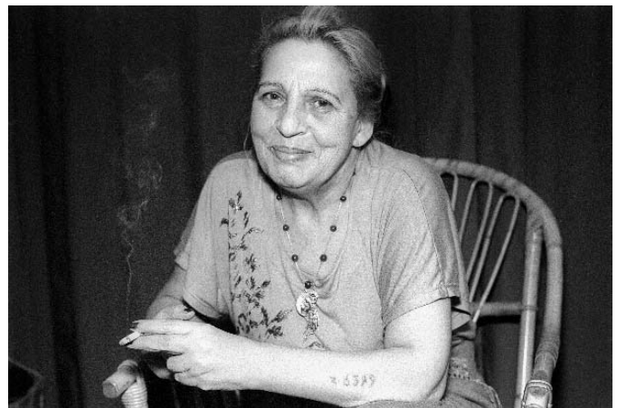
Ceija Stojka, 1995.

Su trabajo sirvió para desvelar la persecución racial a los gitanos en los años treinta y cuarenta, y está en el origen del reconocimiento oficial por parte del gobierno austriaco de su genocidio. Además, fue un impulso para el asociacionismo reivindicativo de ese colectivo. En Austria, el 90 % de la población romaní y sinti fue asesinada según señala Gerhard Baumgartner en el catálogo de la exposición. En el resto de Europa, debido a que las comunidades gitanas estaban menos organizadas que las judías, es más difícil evaluar el número total de asesinados, aunque los expertos creen que se sitúan entre los 220.000 y el medio millón.