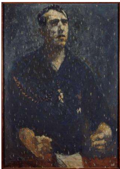
PANCHO COSSÍO Retrato de Ramiro de Ledesma , 1945 Óleo sobre lienzo 105 x 75 cm Museo Nacional Centro de Arte Reina Sofía Donación del Instituto de la Juventud, 1982

El recorrido de este nuevo episodio de la Colección se inicia en la sala titulada La Victoria , donde puede verse la entrada del ejército franquista en Madrid en la película Ya viene el cortejo... (1939), de Carlos Arévalo (1906-1989, España); el Retrato de Ramiro de Ledesma (1945) de Pancho Cossío (1894, Cuba-1970, España) y la serie fotográfica Los artífices de la victoria en cielo mar y tierra (1939) de Ángel Jalón (1898-1976, España), que tratan de reflejar la imagen de una España “triumfal”.