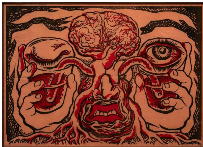
DIEGO RIVERA Los vasos comunicantes , 1939 Linogravado sobre papel 60 x 84,5 cm Museo Nacional Centro de Arte Reina Sofía Deposito indefinido de la Fundación Museo Reina Sofía, 2020 (Donación de Vicente Quilis Moscardó)

En la sala El exilio surrealista en México , que incorpora también abundantes novedades de la Colección, pone el foco en la importante Exposición Internacional de Surrealismo (1940) organizada en México por André Breton (1896-1966, Francia), y en la que la corriente artística se adentró en el tema indigenista. En ella se incluyeron obras de artistas exiliados como Remedios Varo (1908, España-1963, México), de quien se exhibe la pieza El hambre (1938) y de autores mexicanos como Diego Rivera (1886 -1957, México), del que el público puede ver Los vasos comunicantes (1939), un importante depósito realizado recientemente por la Fundación Museo Reina Sofía.