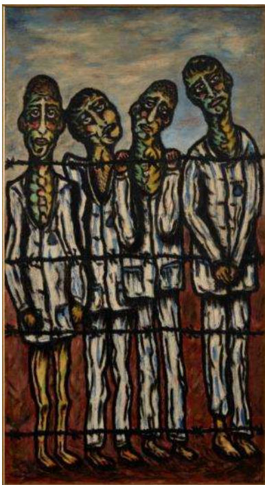
JOSÉ GARCÍA TELLA Esperanza , 1950 Óleo sobre tabla 99,5 x 54,5 cm Museo Nacional Centro de Arte Reina Sofía

La película El éxodo de un pueblo (1939), de los franceses Louis Llech y Louis Isambert , con la salida de los exiliados de España tras la contienda fratricida, abre La retirada y los campos , sala donde comienza a abordarse el periplo de los expatriados. El cuadro de Pablo Picasso (1881, España-1973, Francia), Monumento a los españoles muertos por Francia (1946-47) acompaña las fotografías de Robert Capa (1913, Hungría-1954, Vietnam) de campos de concentración de republicanos como los de Argelès-sur-Mer o Bacarés, (Francia, marzo 1939). Estos campos también fueron dibujados en 1939 por Farinyes y Antonio Rodríguez Luna (1910-1985, España) en unas obras adquiridas por el Museo recientemente.