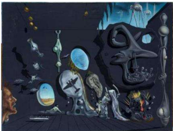
SALVADOR DALÍ Uranium and Atomic Melancholic Idyll (Idilio atómico y uránico melancólico), 1945 Óleo sobre lienzo 66,5 x 86,5 cm Museo Nacional Centro de Arte Reina Sofía Legado Salvador Dalí, 1990

Continuando con la situación en el interior del país, en La vanguardia "frívola en la postguerra" se exhiben algunas expresiones artísticas de la primera modernidad surgidas durante el franquismo, con figuras de referencia como Salvador Dalí (1904-1989, España) que retorna a España, el pintor Luis Castellanos (1915-1946), el grafista Farinyes (Salvador Fariñas; 1901-1991, España), el fotógrafo Santos Yubero (1903-1994, España) o el escultor Ángel Ferrant (1890-1961, España), de quienes se puede contemplar diversas obras en esta sala. De Dalí en concreto se expone Idilio atómico y uránico melancólico (1945), producto de su conmoción por el bombardeo de Hiroshima y Nagasaki.