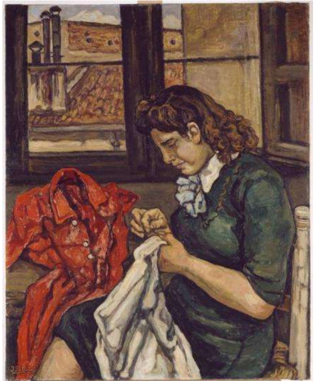
JOSÉ GUTIÉRREZ SOLANA La costurera , 1943 Óleo sobre lienzo 103 x 83 cm Museo Nacional Centro de Arte Reina Sofía

A lo largo de 16 salas de la cuarta planta del edificio Sabatini, se presentan, como en otros episodios de la Colección, numerosas obras nuevas gracias a la política de adquisiciones emprendida en los últimos años por el Museo. Esto ocurre especialmente en el caso de la arquitectura, que aparece de forma transversal en muchos de los espacios que se abren al público.