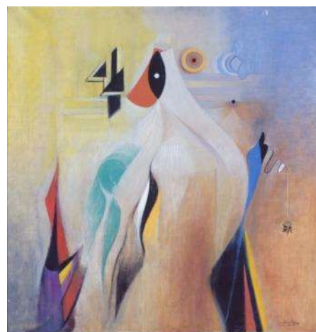
DELHY TEJERO Composición abstracta , 1954 Óleo sobre lienzo de lino 100 x 100 cm Museo Nacional Centro de Arte Reina Sofía

También aparece la Escuela de Zaragoza o Grupo Pórtico , del que se muestra el proyecto de reforma del Cine Dorado de Zaragoza (1949), de Santiago Lagunas (1912-1995, España); así como Dau al Set , donde participan creadores como Joan Ponç (1927, España-1984, Francia), Modest Cuixart (1925-2007, España), Antoni Tàpies (1923-2012, España), y Joan Miró (1893-1983, España), que vivía en aquellos años en Barcelona, y fue todo un referente de estos artistas de la incipiente vanguardia española de Dau al Set .