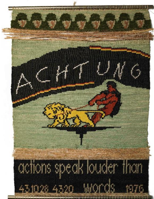
CHARLOTTE JOHANESSON Atención - Las acciones hablan más alto que las palabras , 1976 Lana tejida en telar manual, cáñamo, metal 134 x 100,5 cm Moderna Museet, Stockholm. Purchase 2016 with contribution from The Österlind Foundation / Moderna Museet, Estocolmo. Adquisición de 2016 con la contribución de la Fundación Österlind

La obra de Johannesson entraba en diálogo con la disidencia social y cultural de su época: la contracultura de la década de 1960, el feminismo, el punk y una afinidad intelectual con la militancia de los setenta . En este sentido, los Johannesson comisariaron en 1976 una exposición en Estocolmo tras el suicidio de la terrorista de Alemania Occidental, Ulrike Meinhof. En la tercera sala del recorrido puede verse una reconstrucción de esta exposición, con algunas de las obras y tapices creados para este proyecto, como, por ejemplo, ¡Achtung! Actions Speak Louder than Words [Atención – Las acciones hablan más alto que las palabras, 1976] en la que una figura solitaria trata de refrenar a un león, o Frei die RAF [Libertad para el RAF, 1976], en la que aparece la figura “pixelada en lana” de Snoppy disparando con una metralleta a un tanque.