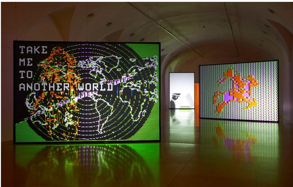
Vista de sala de la exposición CHARLOTTE JOHANNESON. Llévame a otro mundo Museo Nacional Centro de Arte Reina Sofía. Abril, 2021