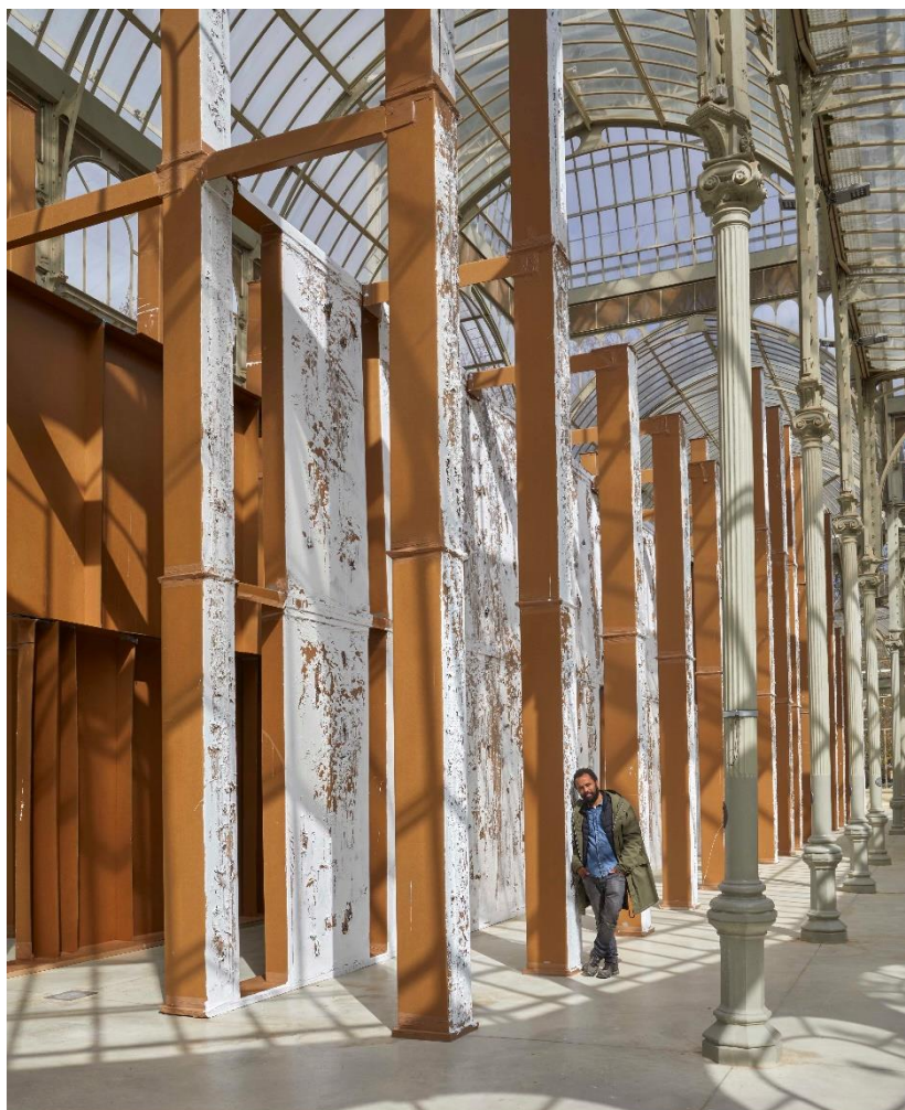
El artista Carlos Bunga , en su exposición en el Palacio de Cristal Museo Nacional Centro de Arte Reina Sofía. Abril, 2022