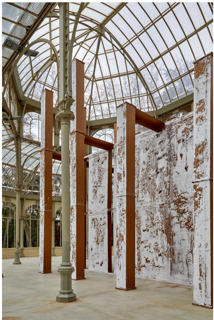
Vista de la exposición CARLOS BUNGA. CONTRA LA EXTRAVAGANCIA DEL DESEO , en el Palacio de Cristal Museo Nacional Centro de Arte Reina Sofía. Abril, 2022

Tras pasar un tiempo en dos centros de acogida en Oporto, los reubicaron en unas casas preconstruidas que el Fondo de Fomento de la Vivienda de Portugal destinó en 1983 a familias portuguesas con escasos recursos, así como a un pequeño porcentaje de refugiados