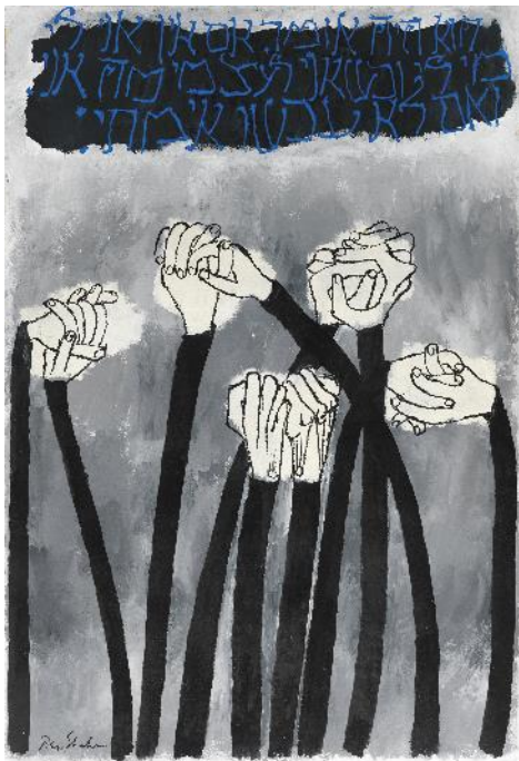
BEN SHAHN Identidad , 1968 Técnica mixta sobre papel 101,6 x 69,8 cm Museo Nacional Thyssen-Bornemisza, Madrid © Estate of Ben Shahn / VEGAP, Madrid, 2023

De la no conformidad es la primera retrospectiva en España de Ben Shahn (Kaunas, Lituania, 1898-Nueva York, 1969), y la primera antológica suya que se realiza en Europa desde 1963. Organizada por el Museo Reina Sofía, reúne cerca de 200 obras procedentes de 50 museos, galerías, archivos y colecciones privadas de Estados Unidos y de España (entre ellos el Museo Whitney y el MoMa de Nueva York), así como abundante material documental y fotografías originales del Smithsonian Institution's Archives of American Art y el Harvard Art Museums.