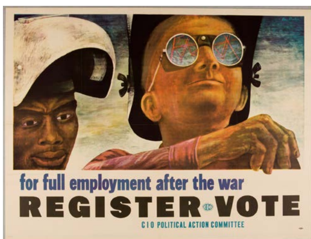
BEN SHAHN Welders (For Full Employment After the War, Register, Vote), 1944 [Soldadores (Por el pleno empleo después de la guerra, regístrate, vota)] Michael Berg Collection

Podría decirse que el mural más exitoso y prestigioso de Shahn, El significado de la Seguridad Social (1940-1942), fue encargado por la Sección de Bellas Artes para el entonces Edificio de la Seguridad Social de Washington D.C. Shahn incluyó a aquellos a los que ayudaría la Ley de Seguridad Social del New Deal, como desempleados, ancianos y discapacitados. También retrató de forma subversiva a los que quedaban fuera de la legislación: agricultores y lo que podría ser una trabajadora doméstica. El mural muestra a trabajadores de la construcción empleados en proyectos de obras públicas, y edificando casas y puentes. Sin embargo, evita tanto la glorificación de los trabajadores que se encuentra en el realismo socialista soviético como la celebración simplista del "estilo americano".