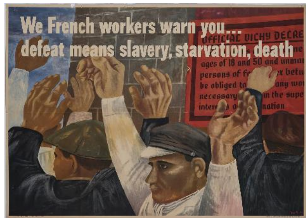
BEN SHAHN We French Workers Warn You...defeat means slavery, starvation death. 1942 Nosotros los obreros franceses os prevenimos... la derrota supone esclavitud, hambruna, muerte Litografía 68 x 104 cm Museo Nacional Centro de Arte Reina Sofía

Ya en medio de la celebración generalizada del triunfo del poder económico y militar estadounidense, Ben Shahn se enfrentó a los horrores de la guerra, desde los campos de exterminio nazis hasta la destrucción causada por las bombas atómicas en Japón. Desde entonces utilizó la alegoría, el simbolismo y el mito para cuestionar el destino de la humanidad en el nuevo orden mundial. Las imágenes de Shahn de actividades cotidianas o de ocio adquirieron un simbolismo inquietante, como en Carnaval (1946), realizada a partir de sus fotografías de carnavales y un parque de atracciones. La enigmática Nueva York (1947) refleja la propia identidad étnica de Shahn cuando se estaba revelando todo el alcance del Holocausto.