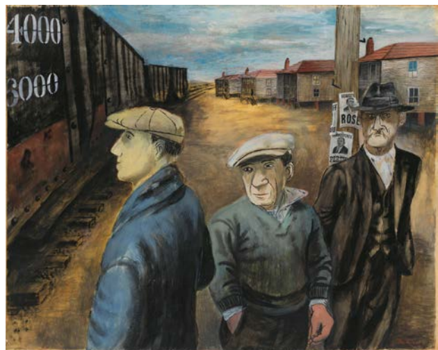
BEN SHAHN Scotts Run, West Virginia (Scotts Run, Virginia Occidental) , 1937 Temple sobre papel montado sobre madera 57 x 72 cm Whitney Museum of American Art, Nueva York. Compra, 38.11 © Estate of Ben Shahn / VEGAP, Madrid, 2023

Los carteles de 1936, como Years of Dust ( Años de polvo ) y A Mule and a Plow ( Una mula y un arado ), que mostraban a trabajadores en paisajes desolados, se inspiraron en los detalles gráficos y las crudas realidades de las emblemáticas fotografías de Shahn para la RA-FSA que el visitante ha podido observar en la sala anterior.