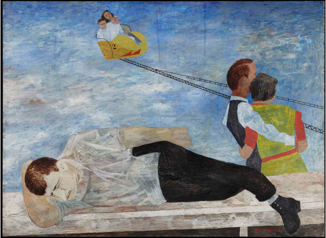
BEN SHAHN Carnival (Parque de atracciones) , 1946 Temple sobre masonita 56 x 75,5 cm Museo Nacional Thyssen-Bornemisza, Madrid © Estate of Ben Shahn / VEGAP, Madrid, 2023