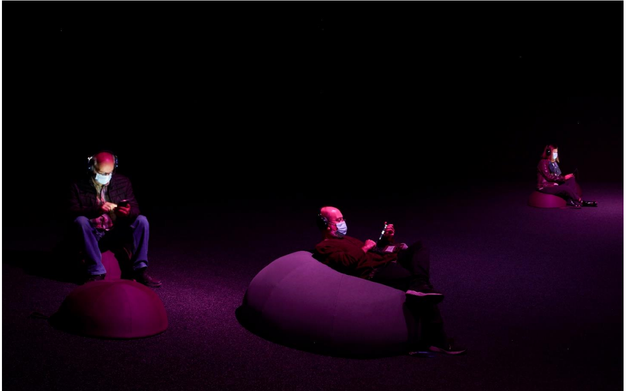
AUDIOSFERA. EXPERIMENTACIÓN SONORA 1980-2020 Museo Nacional Centro de Arte Reina Sofía. Octubre, 2020