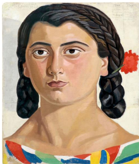
MARUJA MALLO Estudio para Cabeza de mujer , 1940-1944. Óleo sobre cartón 50 x 40 cm

Un grupo documental destacado es el fondo Westerdahl-Domínguez , compuesto por libros, folletos, cartas, fotografías originales, y otros materiales, además de tres obras originales de Oscar Domínguez . Esta parte del Archivo referida a España se completa con miles de revistas. Algunos títulos son muy difíciles de localizar y existen 10 colecciones completas de las revistas Aleluyas de Rompetacones , Arte: revista de la Sociedad de Artistas Ibéricos , Cruz y raya , Cuadernos de Ruedo Ibérico , Hora de España , Los cuatro vientos , Luz , Troços , Tropos y Reflector .