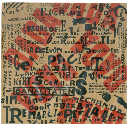
KURT SCHWITTERS y THEO VAN DOESBURG Cartel Kleine Dada Soirée, 1923. Litografía 30 x 30 cm

El Archivo Lafuente cuenta con una amplia y exhaustiva colección del periodo de las vanguardias históricas en Europa y EE. UU . Dentro de la corriente del futurismo , reúne casi medio centenar de obras y documentos: desde los manifiestos más representativos del movimiento, hasta libros, revistas, catálogos e impresos de sus principales exponentes, como Marinetti o Depero . Se trata de una de las colecciones más importantes a nivel internacional.