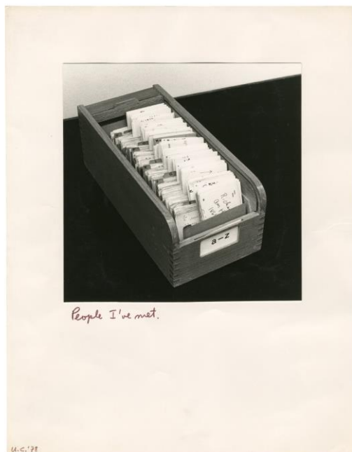
ULISES CARRIÓN People I've met (Serie In Alphabetical Order) , 1978. Fotografía b/n, 32 x 25 cm

El Fondo Ulises Carrión (1941, San Andrés Tuxtla, México-1989, Ámsterdam) consta de más de 11.000 elementos que reconstruyen su trayectoria. Se estructura en dos apartados: uno, su propia creación artística, y dos, la gestión del espacio Other Books and So y el archivo posterior. Es único por la cantidad de piezas relevantes y originales que contiene y la escasa presencia y representación de este artista en las colecciones internacionales. Entre todos estos materiales encontramos obras y publicaciones de otros autores, como Aart van Barneveld , Guy Schraenen o Pawel Petasz . Destaca la parte dedicada a la correspondencia, cientos de cartas de Carrión y otros con artistas de todo el mundo. El fondo se completa con bibliografía sobre arte correo, reediciones de libros del autor y catálogos posteriores a su fallecimiento. El alemán Joseph Beuys (1921-1986) está representado por un extenso compendio de más de 2.000 ítems que ilustra el imaginario y la iconografía elaborada por el artista durante su carrera, así como sus inquietudes políticas.