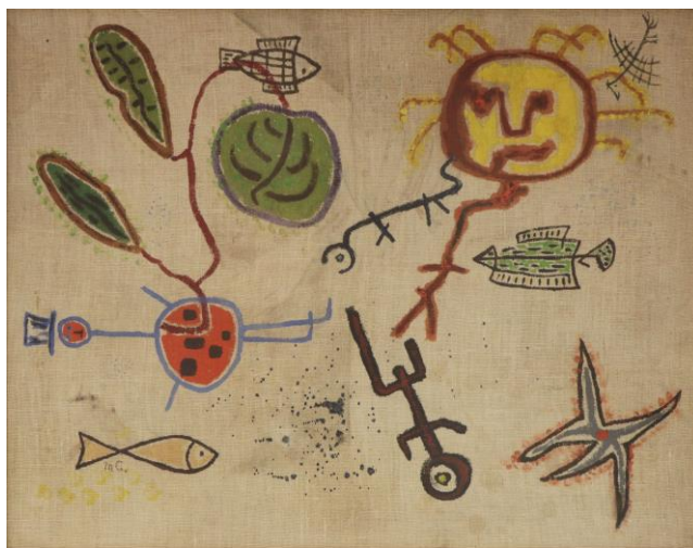
MATHIAS GOERITZ Altamira 1, s. a. [¿1947-1948?]. Técnica mixta sobre yute, 56.5 x 71 cm