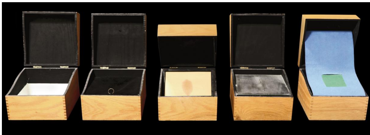
JUAN NAVARRO BALDEWEG Cinco unidades de luz: cinco habitaciones, 1973. Instalación 16.5 x 16.5 x 16.5 cm c/u

nacional e internacional en la aplicación de la informática al arte. Este fondo en particular comprende catálogos, revistas y documentos únicos, como un sobre con facturas del primer Seminario de Generación Automática de Formas Plásticas (un seminario fundamental) o una carpeta relacionada con la exposición Arte geométrico en España 1957-1989 . El conjunto denominado “textos manuscritos/mecanografiados” también es de especial relevancia pues documenta proyectos, trabajos y reflexiones que tenían cabida en esta época en torno al Centro de Cálculo.