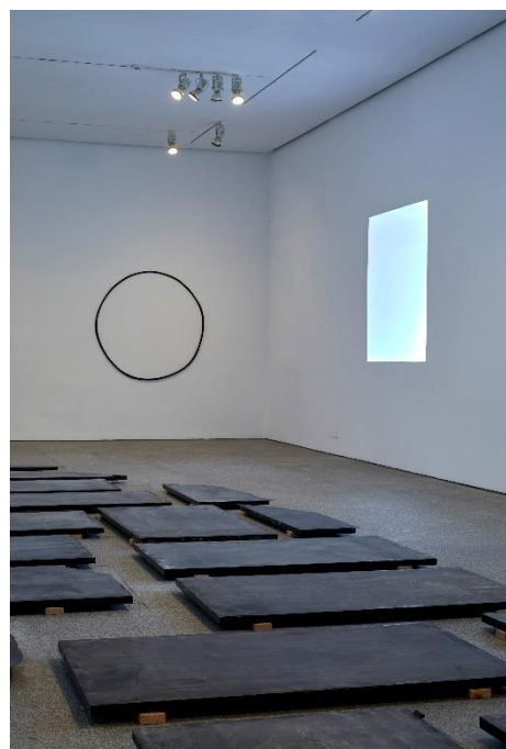
IBON ARANBERRI Zulo Beltzen geometría , 2019 Vista de la obra en la exposición Ibon Aranberri. Vista parcial, en el Museo Nacional Centro de Arte Reina Sofía. Noviembre, 2023

Anexa a esta obra y con claves similares nos encontramos con Política hidráulica (2007) una de sus obras más emblemáticas que forma parte de la colección del Reina Sofía. Esta es una instalación formada por casi un centenar de fotografías de presas y embalses tomadas entre 2004 y 2010, enmarcadas en diferentes tamaños y encuadres. Con una dimensión escultórica, muestra estas