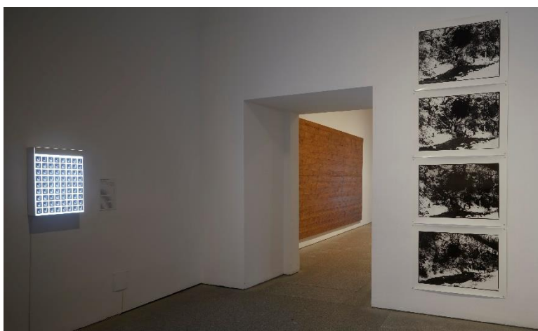
IBON ARANBERRI Fotografías de la intervención en la cueva de Oñate Ir. T. nº 513 Vista de la obra en la exposición Ibon Aranberri. Vista parcial, en el Museo Nacional Centro de Arte Reina Sofía. Noviembre, 2023

Sigue con Luz de Lemóniz (2000), un proyecto/ensayo relacionado con la construcción inconclusa de la central nuclear de Lemóniz (Bizkaia) y la compleja narración que se creó alrededor desde aquellos días hasta hoy.