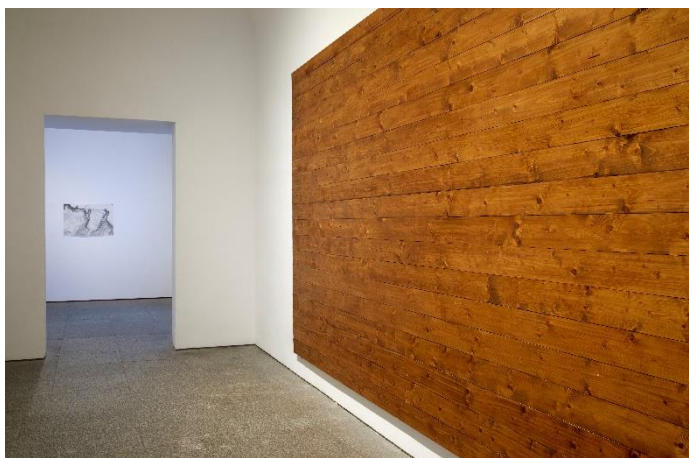
IBON ARANBERRI Disorder , 2007 Vista de la obra en la exposición Ibon Aranberri. Vista parcial, en el Museo Nacional Centro de Arte Reina Sofía. Noviembre, 2023

La exposición, organizada por el Museo Reina Sofía y el Museo de Arte Contemporáneo del País Vasco, Artium museoa, se inicia con los proyectos de Aranberri relacionados con algunas de las preocupaciones que, desde la década de los noventa, han movido al artista: los contornos cada vez más difusos del paisaje postindustrial, el territorio como un lugar de proyección de ideología, el cuestionamiento