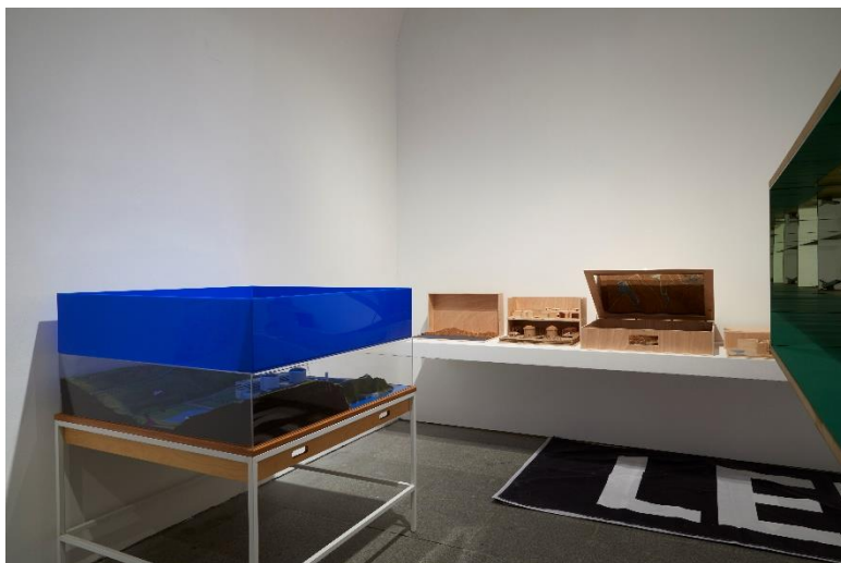
IBON ARANBERRI Luz de Lemóniz , 2000 (detalle) Vista de la obra en la exposición Ibon Aranberri. Vista parcial , en el Museo Nacional Centro de Arte Reina Sofía. Noviembre, 2023

A lo largo de 10 salas y una galería, se exponen obras emblemáticas de Ibon Aranberri