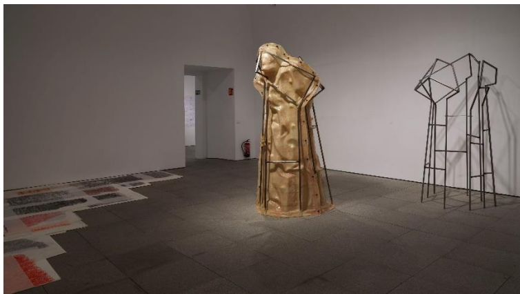
IBON ARANBERRI Modelos y constructos , 2014 Vista de la obra en la exposición Ibon Aranberri. Vista parcial, en el Museo Nacional Centro de Arte Reina Sofía. Noviembre, 2023

Como en la obra Models and constructs Modelos y constructos (2014), que nace tomando como pretexto el molde de fundición para una estatua que representaba al filósofo Miguel de Unamuno y permite a Aranberri deconstruir la intención del monumento a partir de su propia ausencia. Los restos del proceso, así como la idea de vacío que de ellos se desprenden, dan cabida a nuevas lecturas y experiencias estéticas.