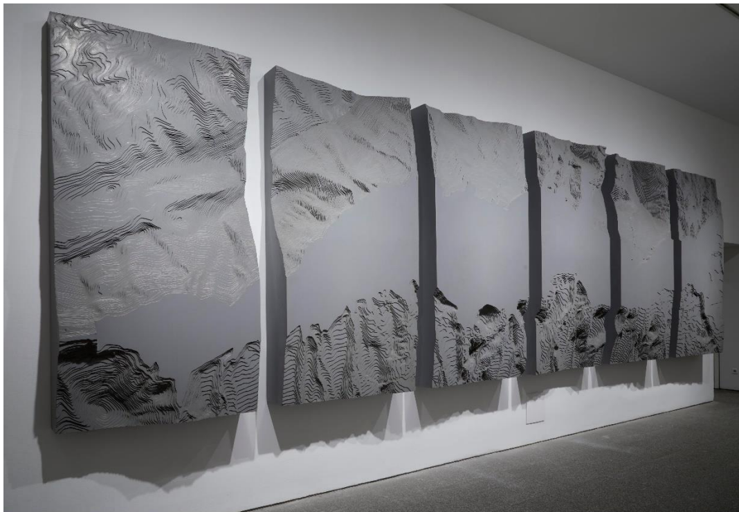
IBON ARANBERRI Mar del Pirineo , 2006

Vista de la obra en la exposición Ibon Aranberri. Vista parcial , en el Museo Nacional Centro de Arte Reina Sofía. Noviembre, 2023