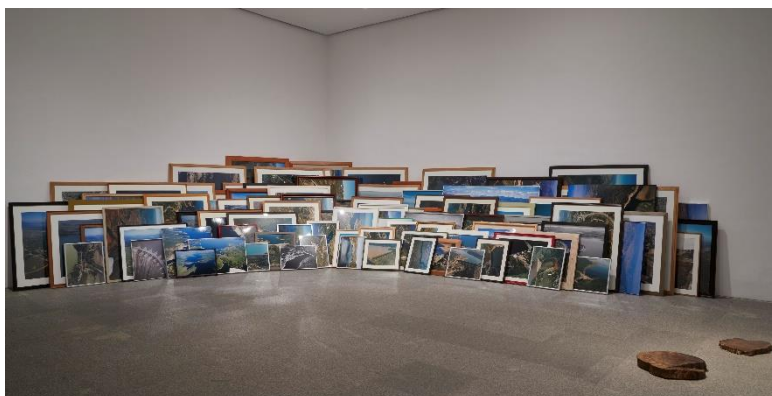
IBON ARANBERRI Política hidráulica , 2007 Vista de la obra en la exposición Ibon Aranberri. Vista parcial, en el Museo Nacional Centro de Arte Reina Sofía. Noviembre, 2023

obras de ingeniería que horadan el paisaje y la mirada y se apropian del territorio.