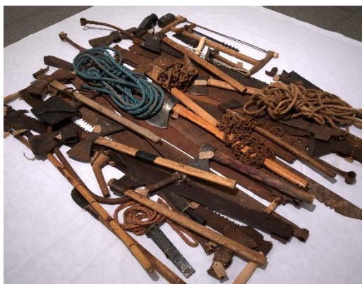
IBON ARANBERRI Compendium, 2022 Vista de la obra en la exposición Ibon Aranberri. Vista parcial, en el Museo Nacional Centro de Arte Reina Sofía, noviembre, 2023

En la última década, el artista vasco se ha interesado especialmente en técnicas y procesos que tienen que ver con el legado de la primera industrialización, reproduciendo elementos o metodologías de registro u ordenación del patrimonio como el proyecto Itzal marra Línea de sombra (2019), que muestra los calcos de lápidas funerarias que se encontraban acumuladas en los almacenes del Museo de San Telmo en San Sebastián, una forma de inventariar previa a la fotografía. O el proyecto Sources without qualities Fuentes sin cualidades (2017), donde Aranberri reproduce un prototipo de mobiliario para la clasificación de objetos inspirado en la época industrial.