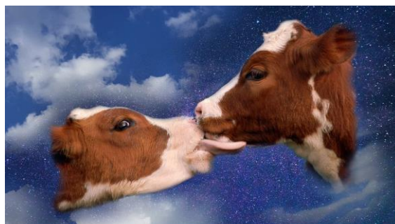
HASSAN KHAN Estudio preparatorio para HAPPY EMPIRE (2019)

Una semana después, el jueves 17 de octubre, a las 11:30 horas , el artista de origen egipcio Hassan Khan (Londres, 1975) presentará su exposición en el Palacio de Cristal . Khan ha concebido un proyecto específico para este espacio que bajo el título Las llaves del reino y conformado por canciones, banderas, esculturas de vidrio, murales generados digitalmente y otros elementos, pretende generar en el visitante una reflexión crítica en torno a la explotación colonial de cuerpos y territorios, así como sus estrategias de codificación y legitimación.